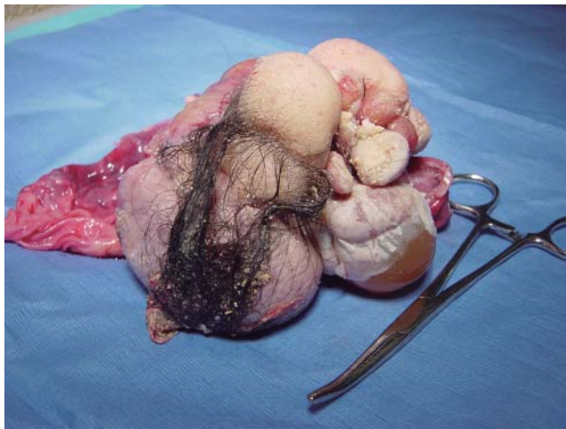
Figura 2. Teratoma maduro.