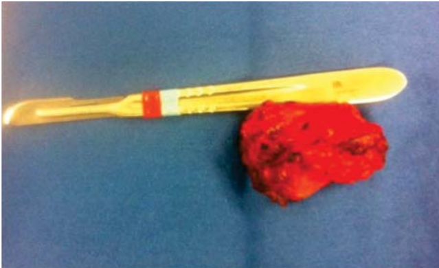
Figura 2. Tumoración en región subescapular izquierda de 5 × 3 cm con componentes fibrosos y musculares. Bordes irregulares, mal definidas en una masa fibroelástica. La superficie de corte muestra líneas en blanco y amarillo del tejido causadas por el atrapamiento de restos grasos, similar a un «tablero». Tumores no encapsulados.

El paciente fue dado de alta dos días posteriores a la cirugía. No fue necesaria otra intervención quirúrgica o terapia adyuvante. Se presentó a consultas postoperatorias cada mes por cinco meses, encontrándose asintomático y sin datos de recurrencia.