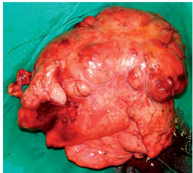
Figura 3. TFSM. Fotografía de la pieza quirúrgica que muestra la adherencia entre el tumor y el lóbulo inferior del pulmón derecho.

De los 2 tumores de pleura parietal, uno tenía diagnóstico citopatológico de neoplasia epitelial maligna. Se practicó lobectomía pulmonar inferior derecha en bloque con el tumor, el cual parecía infiltrar el pulmón