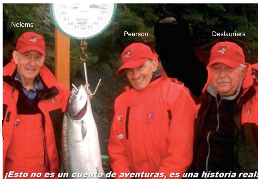
¡Esto no es un cuento de aventuras, es una historia real!

Las plagas y los cirujanos de tórax/ Nacimiento de la cirugía de la vía aérea/ Transplante pulmonar/ La epidemia del cáncer pulmonar/ Trauma torácico/ Explorando las fronteras del mediastino/ Las promesas de la investigación quirúrgica/ El legado canadiense a la cirugía torácica mundial/ Contribuciones de la anestesia/ Dilemas no resueltos/ Mundos nuevos y viejos en la cirugía torácica/ El futuro de la cirugía torácica/ Las 125 publicaciones más importantes.