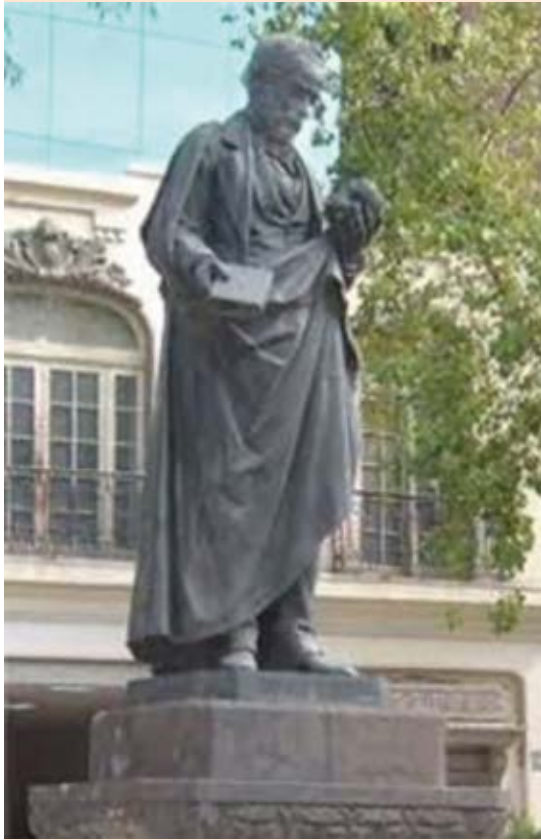
Figura 3. Estatua de Rafael Lucio Nájera.

en los pacientes que experimentan el fenómeno de Lucio-Latapí. 1,2,9,29,30 El Opúsculo es “una excelente y completa descripción clínica y de anatomía patológica macroscópica por aparatos y sistemas, con una interpretación de la patogenia, conceptos terapéuticos y epidemiológicos, que se adelantaron a su época y que continúan vigentes”. 21