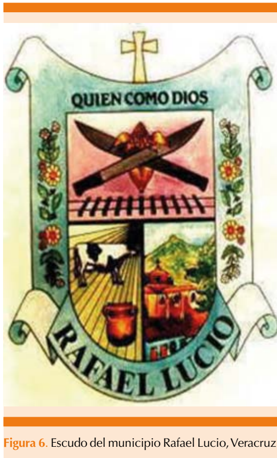
Figura 6. Escudo del municipio Rafael Lucio, Veracruz.

cotidianas de la Academia y en 2008 se bautizó con su nombre a las oficinas y salas, en donde se edita la Gaceta Médica de México. 6,11,40