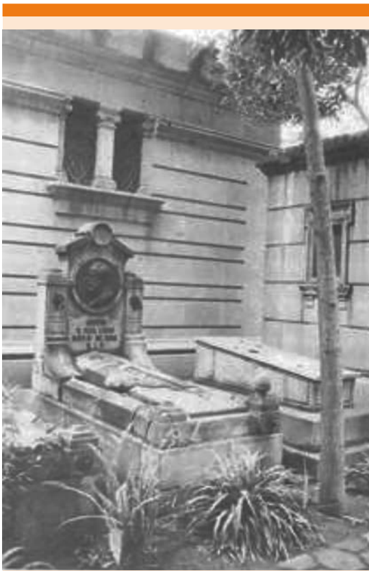
Figura 2. Tumba de Rafael Lucio Nájera.