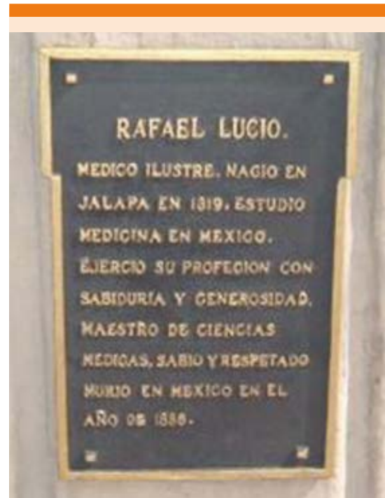
Figura 4. Pedestal de la estatua de Rafael Lucio Nájera.