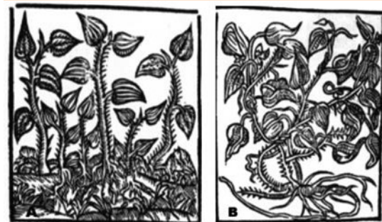
Figura 5. Ilustraciones del Libro 4 de Opera medicinalia en donde se diferencian las dos especies de zarzaparrilla y sus raíces. A. Especie mexicana, Smilax medica . B. Especie europea, Smilax aspera .

El Dr. Bravo describe a la zarzaparrilla como una planta de temperamento caliente y seco, característica que la hace útil para el tratamiento de ciertas enfermedades, en especial la sífilis (el mal francés, por mencionar algunos de sus nombres), contra la que se prescribía tomar grandes cantidades de agua de raíz de zarzaparrilla. En los capítulos octavo y noveno de este cuarto libro se enumeran las enfermedades en la que es útil la raíz de esta planta. En el decimotercero el autor explica cómo preparar la raíz de la zarzaparrilla, el vehículo y cómo prescribirla: “ Es verdad que se le reconoce libremente como polvos o, bien, se presenta como jarabe y como ejemplo ninguno es perjudicial para el cuerpo; no obstante, declara habilidad para aliviar completamente, de tal modo que al hacer cocer esta raicilla en agua, es un hecho aceptado que protege al cuerpo ”. Ya se conocía muy bien que de la planta la raíz era la que tenía propiedades curativas, porque los frutos son tóxicos y no deberían consumirse.