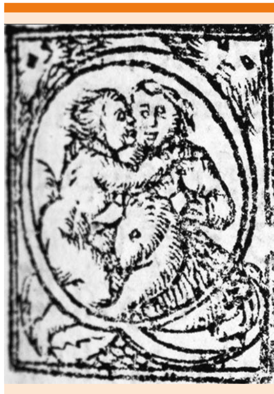
Figura 3. Letra capitular erótica en donde la letra Q semeja una mirilla a través de la que se observa una pareja desnuda.

En relación con la carátula, el Dr. Fernández del Castillo agrega:... “En la parte inferior del grabado hay un emblema que semeja un 4 arábigo usado por los grabadores franceses de la época, y la fecha 1549”. Parecería contradictorio que aparecieran dos distintas fechas en la portada del libro, pero esto se debe a que el grabado usado en la portada venía de Europa, probablemente de Francia, y era común que éste se usara como formato común para varios libros, por la escasez de grabadores, cambiando exclusivamente en el claro el título del libro. Éste es el motivo por el que Pedro Ocharte anota la fecha exacta de impresión en el pie de imprenta. 8