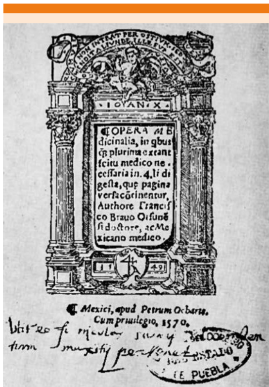
Figura 2. Portada de Opera medicinalia del ejemplar propiedad de la Benemérita Universidad Autónoma de Puebla.