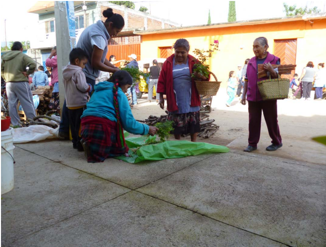
FIGURA 8. Mujeres zapotecas de SMM y Ayoquezco de Aldama realizando el trueque.