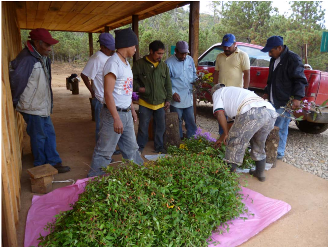
FIGURA 6. Hombres de SMM recolectando poleo para la fiesta de la comunidad.