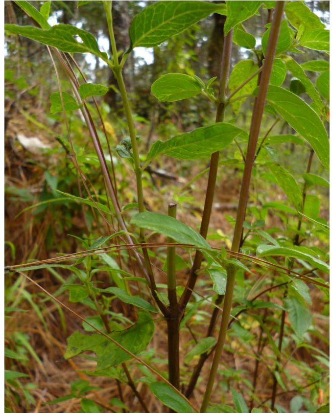
FIGURA 5. Planta de poleo con nuevos brotes a partir del tallo recolectado.