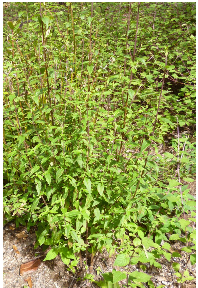
FIGURA 1. Planta de poleo en fase vegetativa.

La venta de RFNM constituye una significativa fuente de ingresos para las mujeres más pobres, de mayor edad y con escasos niveles de educación formal (Schreckenber et al. , 2006; Ahenkan y Boon, 2011; Djoudi y Brockhaus, 2011; Mai et al. , 2011). Tales ingresos también se encuentran en condición de sub-registro ante la existencia de