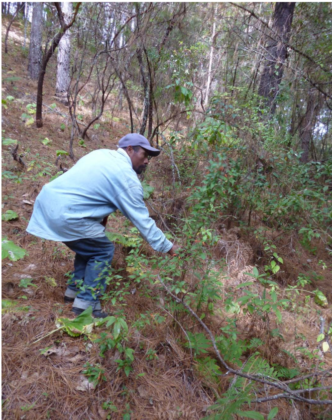
FIGURA 4. Hombre recolectando poleo con la mano.

El poleo responde positivamente a la intervención humana: puede crecer cerca del maíz ya que los “roces” favorecen su desarrollo. La cosecha de madera también lo ayuda: “cuando se corta la madera, ahí... retoña mucho”. Si alguien se encuentra “poleo avejentado”, lo poda para que se renueve: “uno mismo le da su mantenimiento... porque hay... poleos que... ya están secos... pues tienes que cortar abajo para que vuelva a nacer... nuevo poleo, porque si lo dejas nomás pura rama... se va a secar... tú tienes que cortarlo y ya vuelve a nacer”.