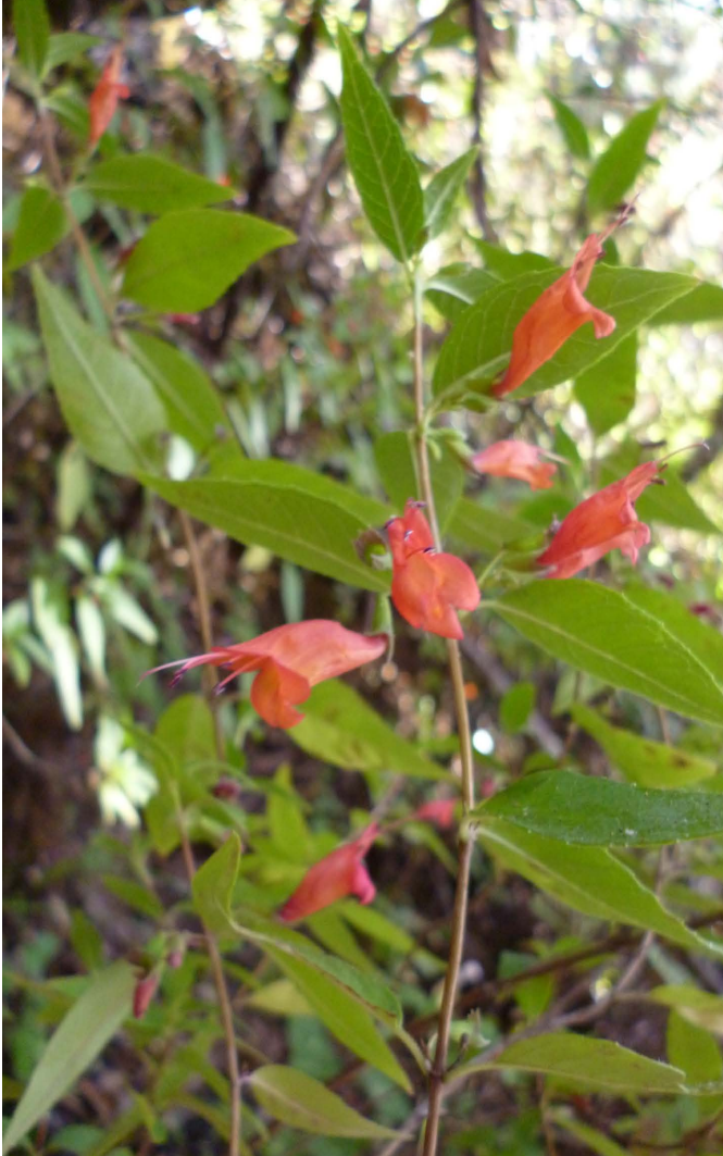
FIGURA 2. Planta de poleo en fase reproductiva.

subsidios gubernamentales, remesas y venta de productos agrícolas, pecuarios o madereros (Quiroz, 1999; Schreckenber y Marshall, 2006; World Bank, 2009; Shackleton et al. , 2011). Por tal motivo, resulta necesario documentar el papel de las mujeres en el aprovechamiento de RFNM con la finalidad de promover el desarrollo integral y sustentable de comunidades forestales. Atendiendo esta preocupación, el presente artículo persigue los objetivos que se detallan a continuación.