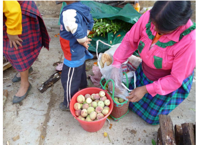
FIGURA 9. Mujer zapoteca de SMM intercambiando poleo y duraznos.

comercialización; la clientela prefiere tallos derechos, con una longitud de 50 cm a 80 cm: “no le van a comprar los que están todos torcidos y feos, se fijan en los que están bonitos, pues, larguitos, bien cortados, en las puntas todas parejitas y eso es lo que se vende”. Para mantener la calidad hasta la llegada al mercado es necesario cubrir al poleo con un plástico o follaje de helechos u otras hierbas. Las ramas se hidratan frecuentemente para que no pierdan turgencia. Para mejorar la presentación en el mercado, el poleo se arregla en manojos de cinco a seis tallos.