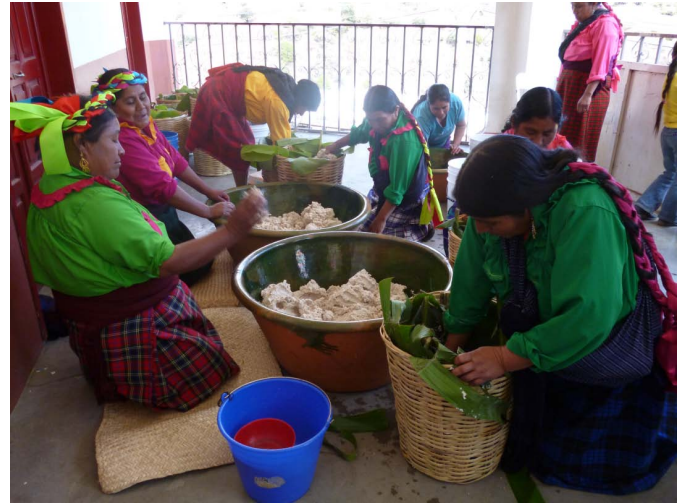
FIGURA 7. Mujeres de SMM preparando los alimentos para la fiesta de la comunidad.

conocimientos diferenciados no sólo de acuerdo al género, sino también a la edad. Por su parte, los hombres se enfocaron en el control de la resaca, uso que hace famoso al poleo en los Valles Centrales donde también se le conoce como rosa, hierba o flor de borracho. Un informante mencionó el control de la fiebre: “agua de mezcal caliente con... poleo, [se aplica en] toda la rodilla y la planta de los pies, por la espalda de uno, en la frente, el cuello y luego tapas [con] dos o tres cobijas, pero primero Dios ya amanece al otro día, ya se va la calentura”. Algunas investigaciones han revelado que el poleo es una fuente importante de antioxidantes naturales (Alonso, 2009; Pérez, 2012). El poleo es importante para el cuidado de la salud porque se encuentra disponible localmente y no es necesario pagar por él.