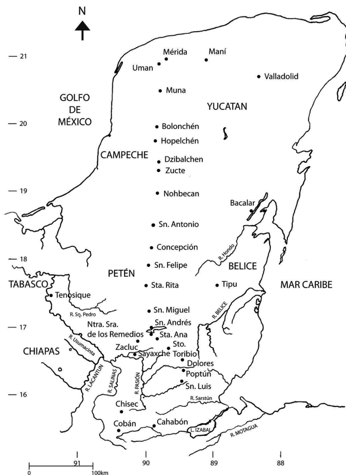
Figura 1. Mapa de la Península de Yucatán y Vamino de Mérida a Nuestra Señora de Los Remedios en El Peten. Siglos XVII–XVIII.