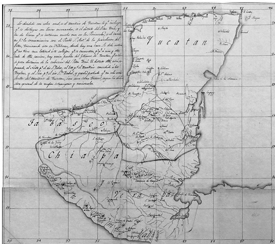
Figura 2. Fajardo, Domingo. Mapa de la Península de Yucatán (1828). Copia por Domingo Lascano. Archivo Histórico Genaro Estrada. Acervo Histórico Diplomático. Secretaría de Relaciones Exteriores de México. Caja 10, N 17, LE 873.