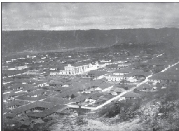
Vista panorámica de San Cristóbal de Las Casas, Teobert Maler, 1877. 1