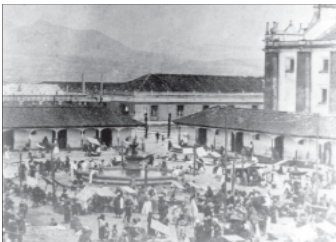
Mercado de San Cristóbal en la Plaza Mayor, anónimo, circa 1890. 27

Toda la difícil situación aquí descrita tuvo repercusiones en los indígenas de los pueblos y parajes cercanos a la antigua capital. Si bien San Cristóbal perdió a partir de 1864 todo protagonismo en los municipios indígenas de Los Altos, siguió conservando cierto control sobre las poblaciones que abastecían de productos agrícolas al mercado de la ciudad.