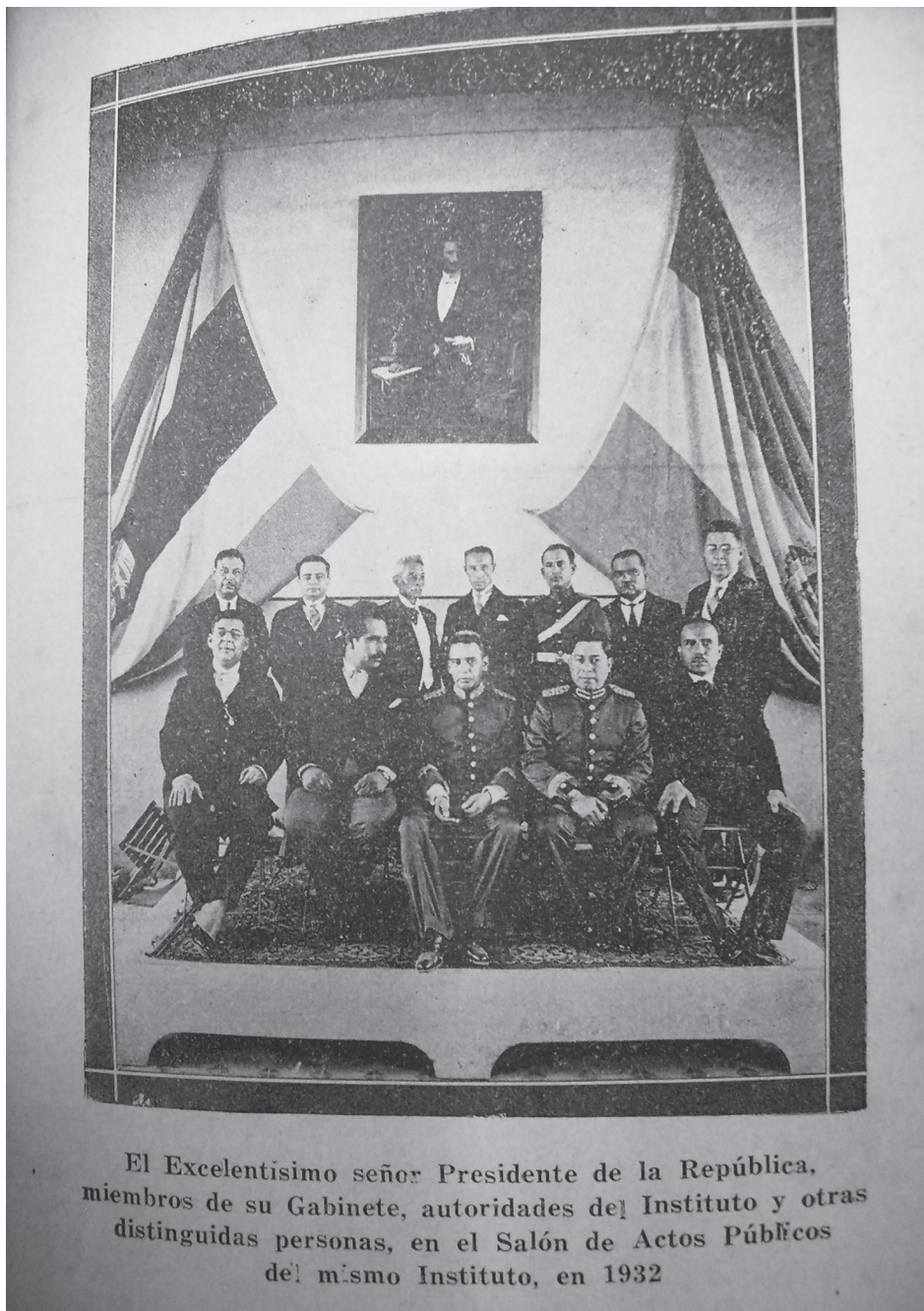
Foto 4. Presidente de la República, general Maximiliano Hernández Martínez (1931-1944), junto con autoridades del Instituto Nacional General Francisco Menéndez, en 1932

Fuente: Revista del Instituto Nacional General Francisco Menéndez , año III, núm. 20, julio a diciembre de 1933. En Colecciones Especiales de la Biblioteca Florentino Idoate, Universidad Centroamericana José Simeón Cañas, San Salvador.