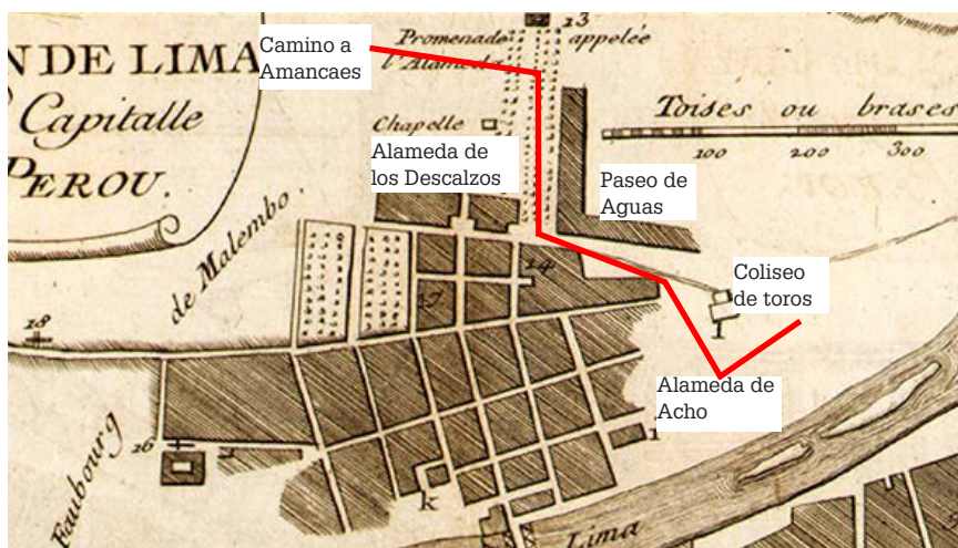
Figura 2 Vista parcial del plano de Lima de Amédée-François Frézier, 1713, utilizado para ubicar la Alameda de los Descalzos, paseos y otras áreas verdes a fines del siglo XVIII