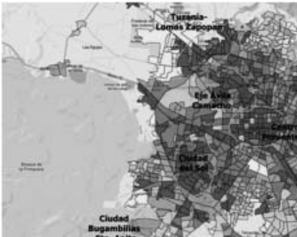
Mapa 2. Área Metropolitana de Guadalajara: porcentaje de mujeres activas de más de 14 años por AGEB.