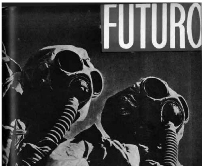
Imagen 4. Portada en Futuro , núm. 42, agosto, 1939.

Medio millón de antifascistas españoles —en números redondos— logró escapar a la barbarie franquista, refugiándose en el Extranjero, ora través de la frontera pirenaica, ora partiendo de los puertos mediterráneos leales, rumbo a Francia o al N. de África. ¿Cuál ha sido la suerte de estos desventurados, cuyo único delito fue defender la independencia de su patria, al tiempo que luchaban por la libertad del mundo? 52