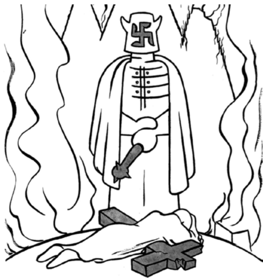
Imagen 3. Guerrero, X. “Paz con paz, guerra con guerra”, en Futuro , núm 44, octubre, 1939, p. 16.

encarnado en un sacerdote que, desde el infierno y cubierto con una máscara que tiene una esvástica, condena a los inocentes en nombre del catolicismo. Las imágenes performativas y el discurso cargado de imágenes sensoriales contribuyen en la creación (poiesis) de una atmósfera terrible.