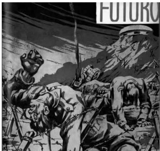
Imagen 5. Portada en Futuro , núm. 44, octubre, 1939