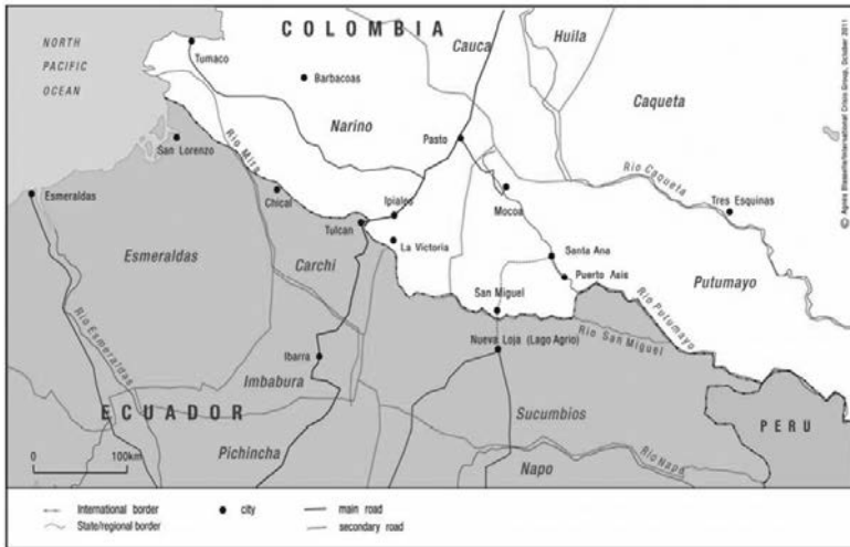
Mapa 1. Frontera Colombia-Ecuador

International border = frontera internacional State/regional border = frontera estatal/regional City = ciudad Main road = carretera principal Secondary road = carretera secundaria