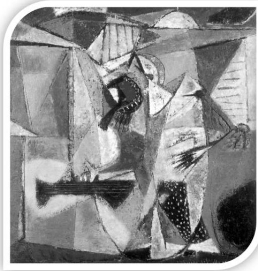
Veji-gantes , de 1955, tomado de Verlee Poupeye, Caribbean Art , Nueva York, Thames and Hudson, 1998, p. 118.

El trazo se detiene en un espacio donde abunda el color amarillo: la axiología de una estética afroamericana. La luz parece iluminar todo el cuadro, África está presente en toda América, con un número mayor de descendientes en aquellos lugares que recibieron mayor número de esclavizados: Brasil y las islas del Caribe. El autor-pintor no cesa de pintar tonalidades claras cuando afirma que la riqueza de esas culturas orales está predominantemente, en las culturas llamadas de la resistencia, aunque aclara que el término no le satisface del todo.