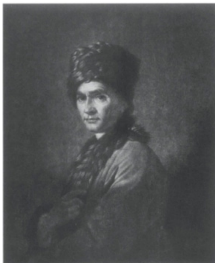
Figura 2. Grabado de Rousseau a media tinta por David Martin. Londres, 1766.