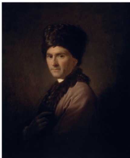
Figura 1. Retrato en óleo de Rousseau por el pintor inglés Allan Ramsay. Londres, 1766.

Nota: Fue un regalo del pintor a David Hume.