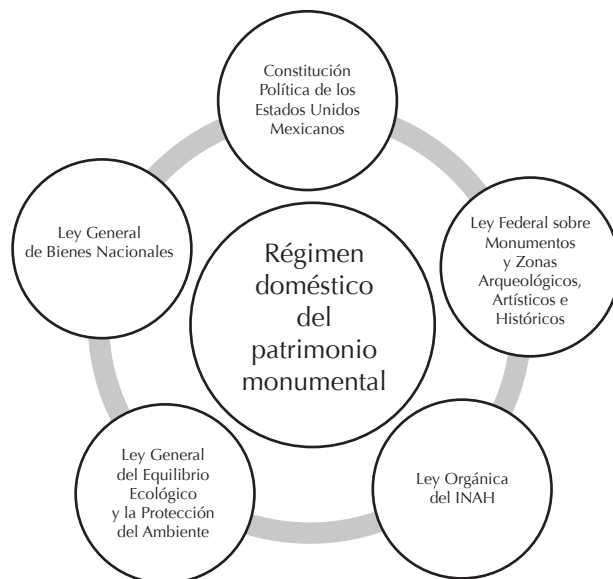
FIGURA 4. Régimen doméstico del patrimonio monumental en México (Esquema: Miguel Ángel Mesinas Nicolás).

Para concluir, menciono que este REPORTE, lejos de proponer un análisis acabado que establezca un ideal conseguido, señala que la trayectoria mundial del derecho del patrimonio cultural será gradual. No obstante que no es fácil de alcanzar su empresa, en México, gracias a su legislación y a la formación de instituciones como el INAH, se ha iniciado el camino. Espero que su desarrollo continúe apoyado no sólo desde el cuerpo de las relaciones internacionales sino también desde el paisaje interdisciplinario, el cual permitirá enriquecer, consolidar y fomentar el desarrollo de esta normatividad, en aras de abarcar al máximo aquellas necesidades culturales de una sociedad que permiten que el ser humano viva en plena libertad.