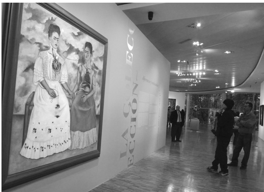
FIGURA 5. Las dos Fridas, 1939, Frida Kahlo (1907-1954). Exposición Diferencia y continuidad en el arte moderno mexicano.