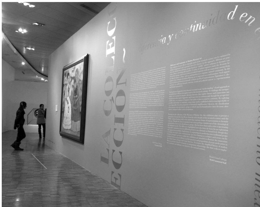
FIGURA 4. Acceso a la sala D en la planta alta del edificio principal del MAM-INBA, México.