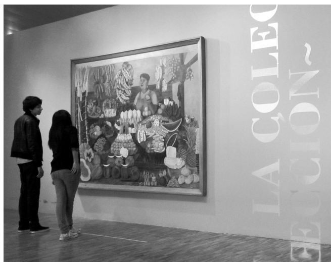
FIGURA 3. Espectadores en el módulo introductorio de la exposición Diferencia y continuidad en el arte moderno mexicano , presentada en el MAM-INBA, México, entre 2011 y 2012 (Fotografía: Norma A. Ávila Meléndez 2012; cortesía: MAM-INBA, México).

y español, una cédula particular, pie de objeto y logotipos de patrocinadores acompañaban a Las dos Fridas , obra pictórica de Frida Kahlo que posteriormente fue sustituida por La vendedora de frutas de Olga Costa (Figura 3).