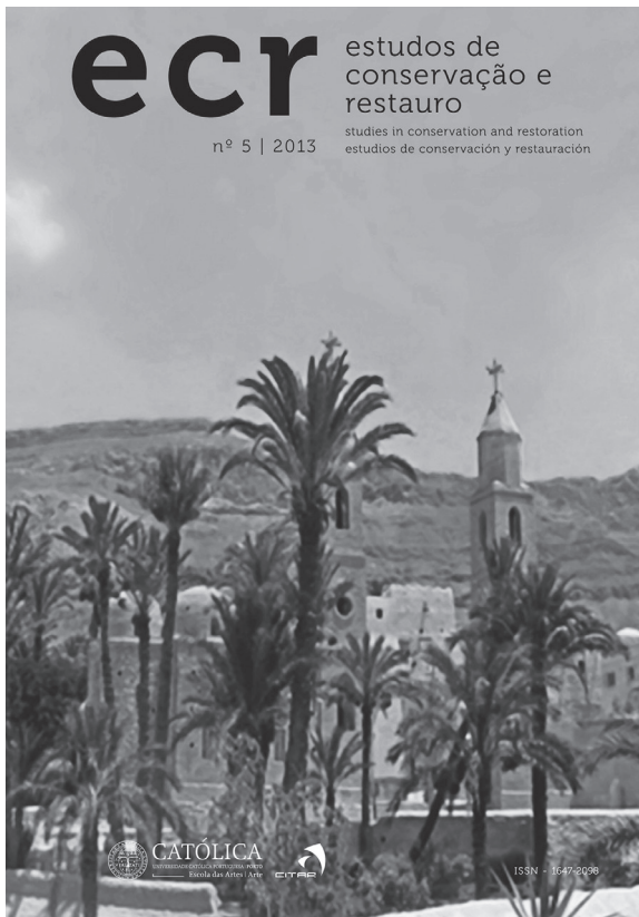
FIGURA 4. Portada del número 5 de ECR (Cortesía: ECR , UCP).

promover la difusión del conocimiento científico en régimen de acceso abierto.