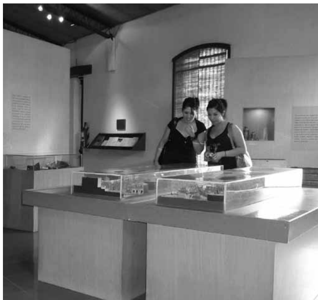
FIGURA 11. El MAF es un espacio donde se genera el encuentro entre personas (Fotografía: Florencia Puebla Antequera; cortesía: MAF).

El estudio evidenció, asimismo, sus puntos positivos y errores, que desconocíamos hasta el momento; reveló, además, información muy valiosa sobre cómo las personas se desenvuelven dentro del MAF. Por ello consideramos que los estudios de público, lejos de ser un fin en sí mismo, son un punto de partida para afrontar el desafío de generar museos críticos y reflexivos respecto de su presente patrimonial.