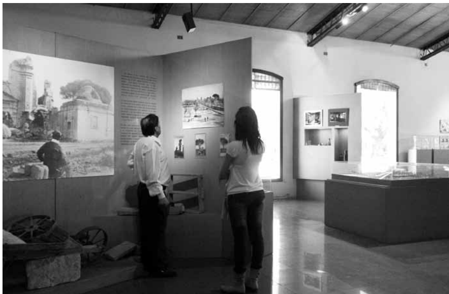
FIGURA 9. Visitantes recorriendo la muestra del MAF.

Al mismo tiempo, por las encuestas actitudinales concluimos que las personas de las visitas de tipo educativo de Mendoza, y turístico del país, fueron las que mayormente modificaron sus concepciones sobre el pasado de la ciudad tras visitar el MAF, seguidas por aquellas de visitas educativas provenientes de diversos puntos de la Argentina. Entendemos que esto se debe a que los que no viven en esta provincia tienen poco o nulo conocimiento sobre su pasado, por lo que el MAF les enseña algo que no sabían y no habían aprendido en otro lugar —la