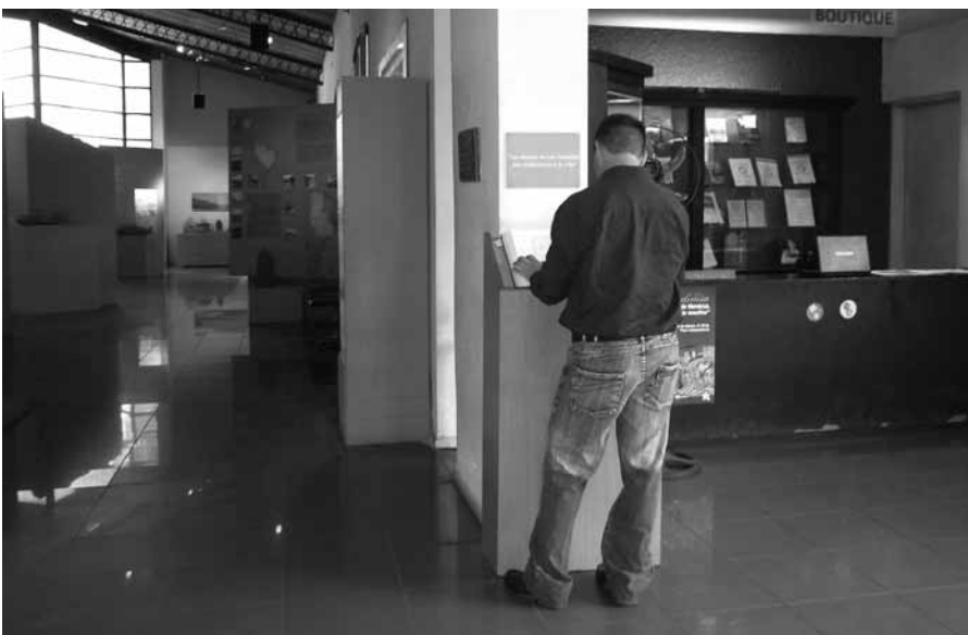
FIGURA 10. Visitante escribiendo en el libro de visitas.

escuela, por ejemplo—, como sí sucede con los oriundos de Mendoza. En el caso de quienes acudieron al museo con la escuela, están aprendiendo sobre el pasado de su ciudad, por lo que el periplo ayuda en ese proceso de conformación de conceptos, aportando nuevas ideas y conocimientos que en la escuela no se brindan, como es la ciencia arqueológica, la toma de conciencia sobre la preservación del patrimonio y otras concepciones que se desarrollan concomitantemente, como es la identidad, la memoria, el pasado, etcétera.