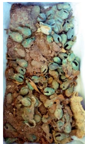
FIGURA 2. Aspecto del entierro en el edificio Cascabeles y de las Tobilleras después de su excavación.