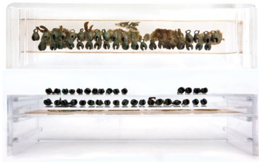
FIGURA 8. Aspecto de las tobilleras al final de su conservación, restauración y montaje (Fotografía: ©Joseph Bolt, 2012; cortesía: CNCPC-INAH).

discursiva de la pieza. Es innegable que la capacidad del objeto para ser leído como evidencia arqueológica fue lo que orientó la mayoría de las decisiones durante su restauración. Las tobilleras son un claro ejemplo de una serie de manifestaciones artísticas que vinculan a las personas con su pasado y, como mencionan Mason y Avrami (2000: 16), “brindan un contacto físico con estas épocas previas”. Es justamente este “contacto” el que se persiguió a lo largo de esta intervención y montaje.