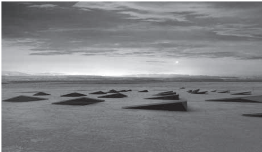
FIGURA 2. Proyecto arquitectónico LIMAC, Estudio Productora, México (Render Estudio Productora, 2006; cortesía: LIMAC).

Esta institucionalidad-otra se configura también en su proyecto arquitectónico. El LIMAC propone una edificación invisible, un espacio enterrado en el desierto ubicado al lado de una de las carreteras de acceso a la ciudad de Lima, en contraposición al museo-firma que se plantea como un acento arquitectónico en el espacio urbano. A la visibilidad del museo global Gamarra contraponen la fisura en la tierra misma del desierto peruano.