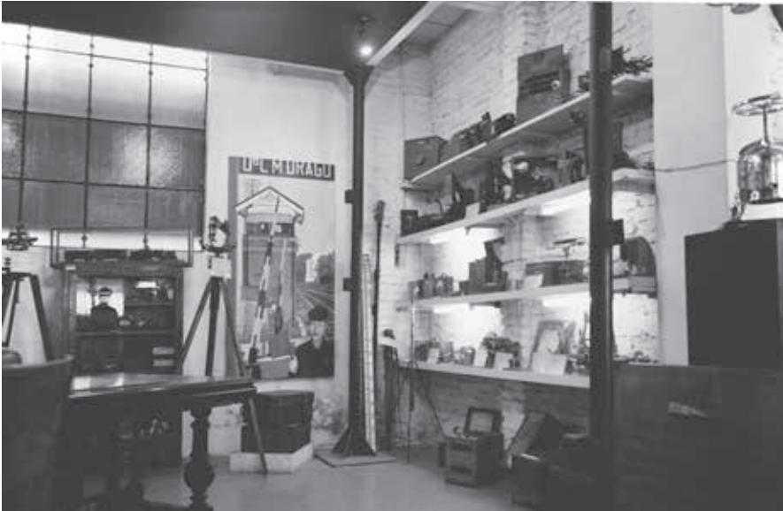
FIGURA 3. Ferro-carriles Argentinos , Museo Nacional Ferroviario, Argentina (Fotografía Patricio Larrambebere, 1998; cortesía del artista).