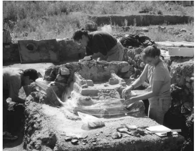
FIGURA 3. Preparación para el desprendimiento de altar en La Ventilla.