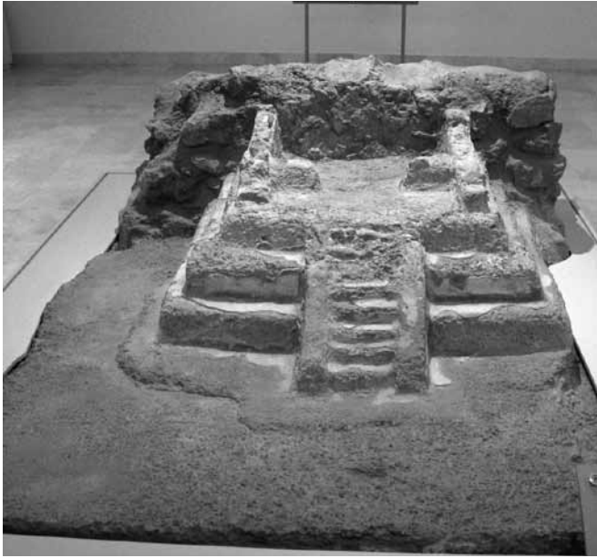
FIGURA 4. Altar que se exhibe en el Museo de Murales Teotihuacanos "Beatriz de la Fuente".