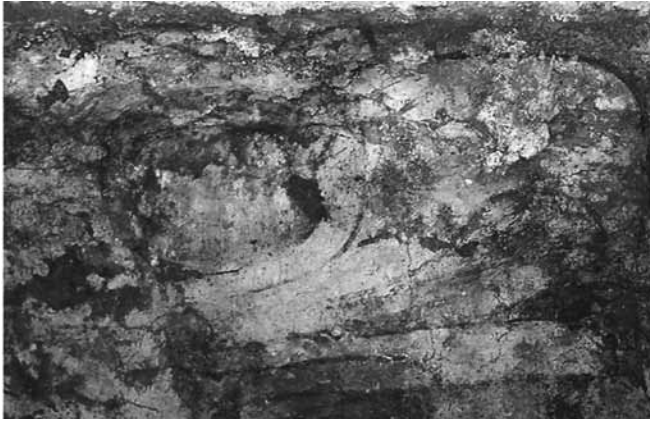
FIGURA 2. Uno de los murales que fue desprendido, donde se aprecia el oscurecimiento y cambios en la textura de la capa pictórica.

de ser intervenidos ya era, según Gaytán, deplorable. Describe que los aplanados se encontraban muy frágiles y quebradizos, presentaban separación de repellido en muchos puntos, grietas, y calcula que la decoración se había perdido en 25%. Asimismo, se reporta que el develado fue muy lento, ya que las pinturas “no tenían aplanado, sino una lechada de cal” (Gaytán 1964:3-4).