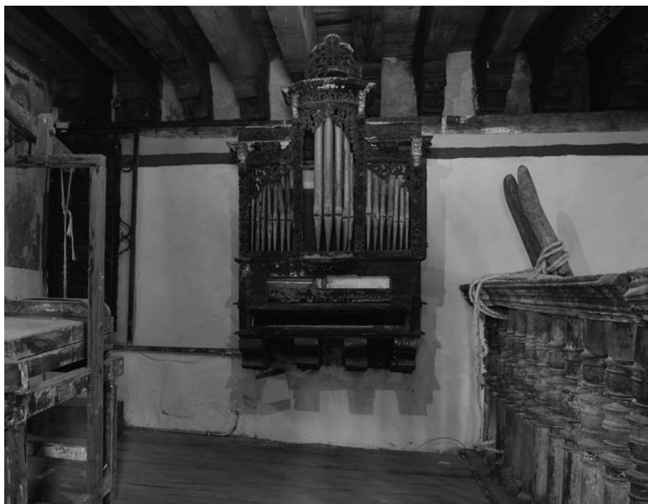
FIGURA 3. Coro con el órgano y los fuelles tal y como se encontraban en septiembre de 2008.

en su diseño; la limitada relación de la arquitectura con el mueble, dada su inusual ubicación (en el coro); la amplia variedad de materiales constitutivos; las diversas técnicas de construcción empleadas; la compleja dinámica de deterioro que ha sufrido el instrumento, así como la cantidad y diversidad de reparaciones y alteraciones presentes. Cabe señalar que en este primer acercamiento todos estos aspectos parecían poco claros: algunos aparecían revueltos, mientras que otros se percibían como inconexos. En ese momento, para mí era imposible aprehender de un solo golpe toda la información que engloba un órgano histórico. Fue en el transcurso de la práctica de campo, y gracias a las posteriores actividades de investigación del proyecto, como muchos conceptos comenzaron a adquirir sentido. Así, el principal reto de la primera visita fue reconocer la gran complejidad y variedad de los datos inmersos del instrumento musical y su contexto, con el fin de iniciar la sistematización de información que permitiría lograr un conocimiento más amplio de la problemática general a la que se enfrentaba el proyecto (Figura 3).