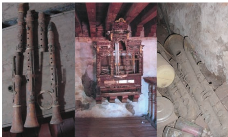
FIGURA 2. Estado de deterioro del órgano, del inmueble y de los instrumentos de viento ubicados en el coro.

La realización de la descripción formal del órgano de Tepemasalco se convirtió en todo un reto, debido a diversos factores: la complejidad del instrumento en cuanto a su funcionamiento y a la naturaleza de su mecanismo; la rica iconografía involucrada