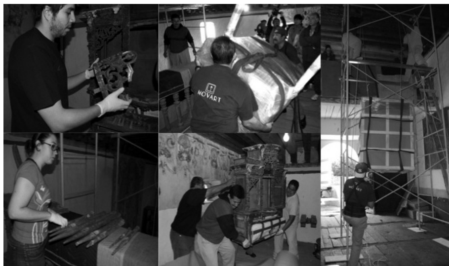
FIGURA 5. Embalaje y traslado del órgano en su caja de madera en noviembre de 2008.

Como alumno, es difícil estar inmerso en un proyecto de conservación tan complejo como el del órgano de San Juan Tepemasalco. Durante éste me planteé varias dudas y preguntas: ¿Qué representa un órgano tubular histórico? ¿Esta es la pieza que me tocó restaurar en el semestre? ¿Por qué no trabajo uno de esos aerófonos de cerámica prehispánicos que puedo restaurar en un par de semanas? ¿Cuento con el conocimiento o las habilidades suficientes para afrontar este reto? Cuando ingresé en el STOCRIM, concebía los órganos como “plantas exóticas impropias de un lugar” (Taffall y Miguel 1876:4). Jamás pensé que