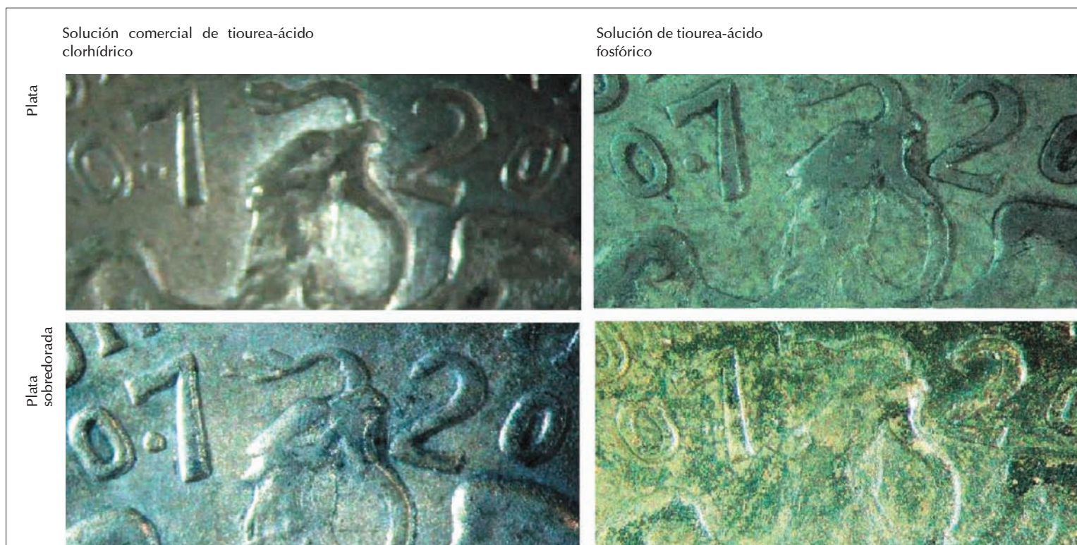
FIGURA 4. Resultados de la limpieza: con las dos soluciones de tiourea y electrolítica.

les— hacer que esto suceda. Debemos dejar de actuar como si Plenderleith hubiera resuelto todo en un solo libro, como si todas las preguntas ya se hubieran planteado y respondido de la única forma posible.