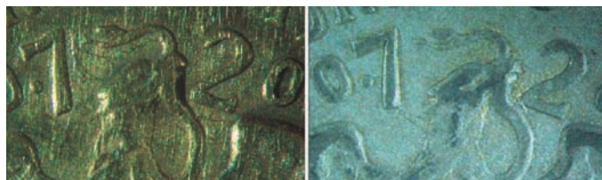
FIGURA 3. Detalles de las superficies de las probetas de plata sobredorada vistas al microscopio estereoscópico; la de la izquierda, limpia; la de la derecha, corroída.

Tras cinco minutos de inmersión, esta solución generó en la moneda de plata una limpieza homogénea, aunque una