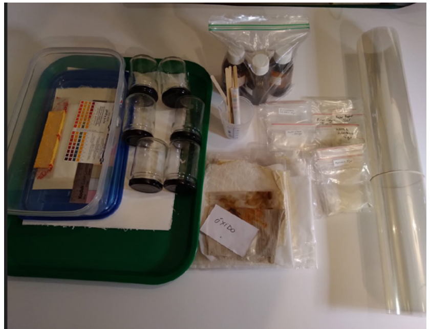
FIGURA 2. Kit de materiales.

Dos meses antes del comienzo del curso, las docentes enviaron por medio de Google Drive el enlace a una carpeta de acceso compartido con información clave para que las estudiantes se anticiparan a los contenidos teóricos: programa, bibliografía inicial y conceptos base.