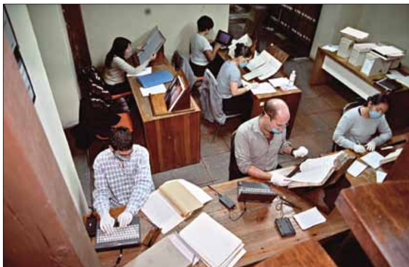
Figura 2. Sala de consulta del Archivo Histórico del Distrito Federal, el autor de estas líneas se localiza a mano derecha y al centro.

en el papel se pueden apreciar tenues manchas, más o menos uniformes, lo que denota que en algún momento se escribió con tinta en ellas, pero ésta se evaporó, sin que el papel se afectara, lo que atribuyo a las condiciones climáticas. Afortunadamente, en la actualidad este archivo se encuentra en una habitación con aire acondicionado. Este recinto, por cierto, recibe muy pocos investigadores, llegando a ser por varios días el único individuo consultando.