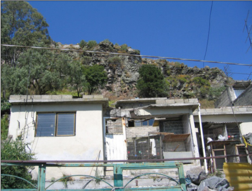
Figura 2. Foto de casas de la calle Independencia asentadas sobre el piedemonte del cerro El Barrigón. En el segundo plano de la fotografía se observan las laderas de donde afloran rocas con pendientes pronunciadas, 6 /11/2009.

rocoso, cuyos habitantes se encuentran en constante estado de riesgo, ya que existe la posibilidad de que otras rocas se desprendan de las laderas. Si bien los daños registrados el 30 de junio de 2006 fueron limitados, no por ello se deben minimizar, ya que los daños sufridos se tornan graves para quienes los experimentan, porque la vivienda no sólo es un bien material, sino también simbólico,