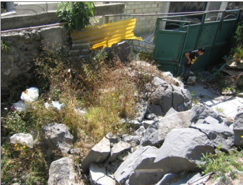
Figura 3. Bloques de roca desprendidos de las laderas superiores del cerro depositados al interior de una casa, en la que sus dueños ya no pueden vivir, la utilizan como gallinero, 6 /11/2009.