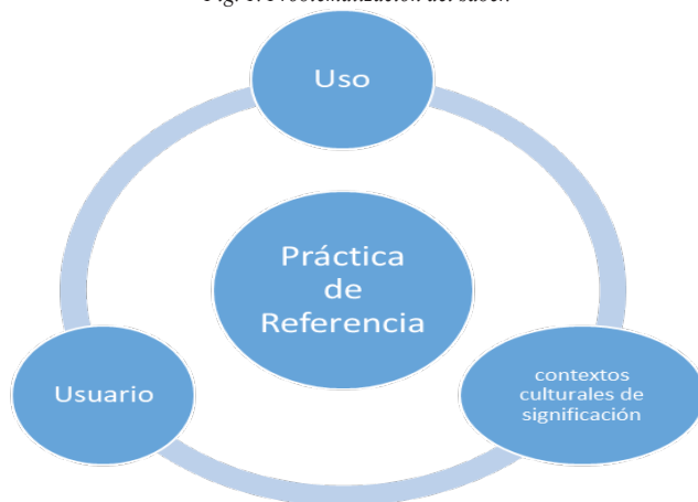
Fig. 1. Problematización del saber.