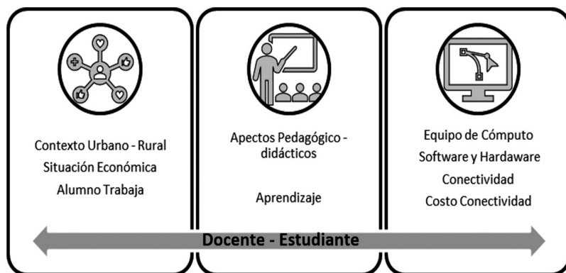
Figura 2. Aspectos que influyen en los docentes y estudiantes

Frente a ese panorama, la falta de equipo de cómputo actualizado y problemas con la conectividad representó un problema a la hora de conectarse a las sesiones sincrónicas de la clase, lo que impidió participar activamente. Si el docente grababa la sesión, facilitaba el acceso a los estudiantes, una vez resuelta la conectividad, pero si no, se quedaron grabadas las sesiones, lo que ocurrió en casi el 50% de las clases, el estudiante no pudo ponerse al corriente.