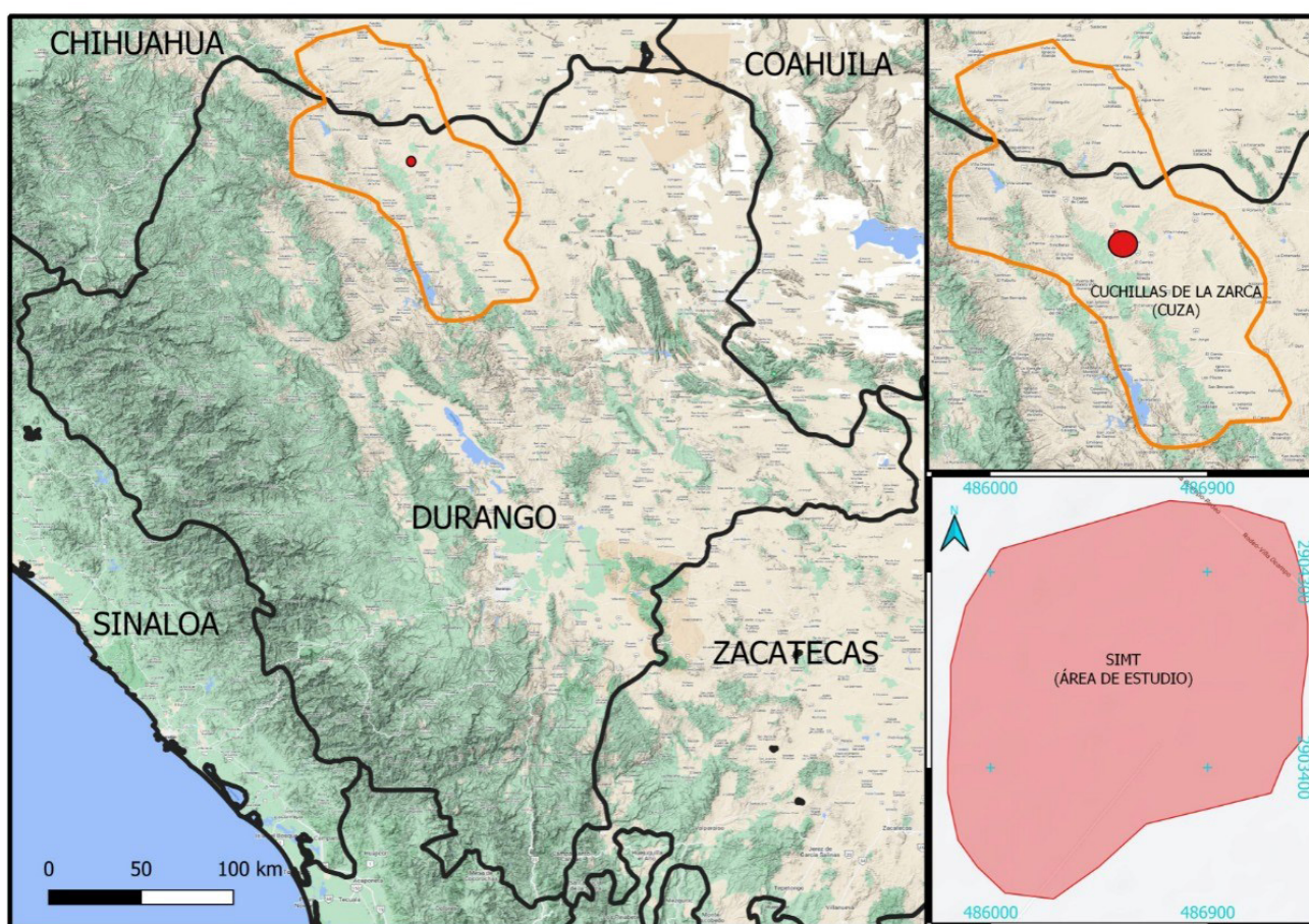
Figura 1. Localización del área de estudio en la Región Prioritaria para la Conservación de Pastizales, Cuchillas de la Zarca, Durango, México.

Para la captura de las aves participamos de 8-10 personas y usamos tres redes de niebla de 12 m de largo cada una, las cuales colocamos en forma lineal con un espacio de captura de 36 m de largo. Conducimos las aves hacia las redes desde una distancia de entre 100 y 150 m utilizando la técnica del arreo, avanzando después de cada intento a lo largo del pastizal. La captura inicial de aves se realizó durante los primeros 4 días del periodo de estudio, entre las 7:30 y 11:30 h, posteriormente solo se capturaron aves que reemplazaran a las encontradas muertas (frio, depredación) o perdidas. Una vez capturadas las colocamos anillos metálicos de identifi-