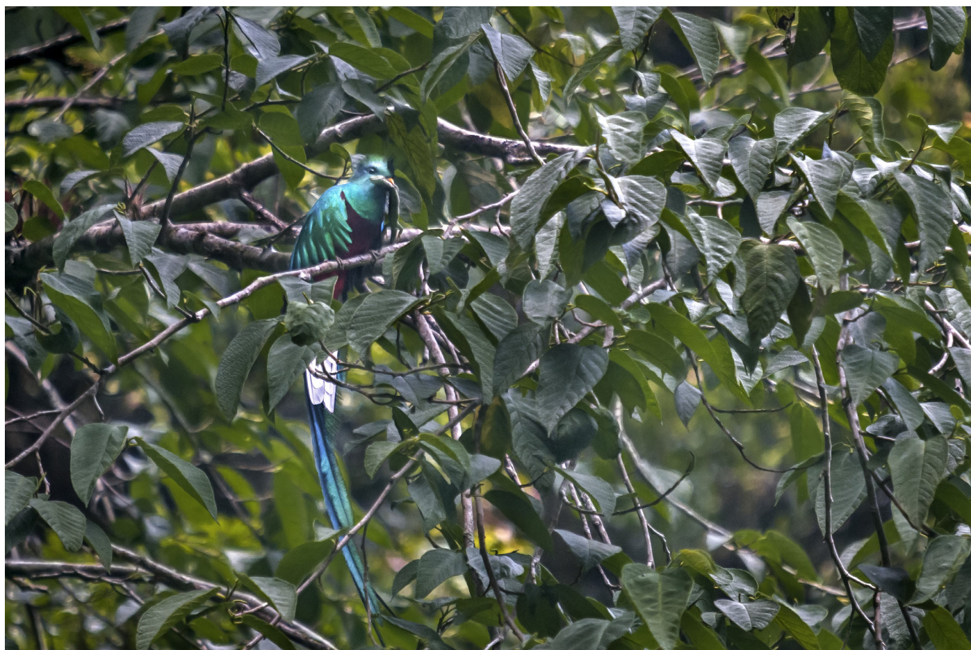
Figura 2. Adulto macho de quetzal mesoamericano ( Pharomachrus mocinno ) fotodocumentado el 3 de mayo de 2016 depredando a un ejemplar de la especie dragoncito de Smith ( Abronia smithi ) en la zona núcleo I de la Reserva de la Biósfera el Triunfo, Sierra Madre de Chiapas, México.

El 12 de julio de 2020, observamos a un quetzal macho adulto depredando a una lagartija del género Abronia . Inferimos que la lagartija sea posiblemente A. lythrochila de acuerdo a su distribución endémica y las características morfológicas observables de la presencia de manchas rojizas-anaranjadas en labios y región temporal. Durante alrededor de 10 mins atestiguamos como el quetzal bajó al suelo desde su percha en lo más alto de la copa de los árboles a unos 30 m de altura, subiendo después a su percha un ejemplar de dragoncito del género Abronia sp., que se dejó caer al suelo presumiblemente como un método de con-