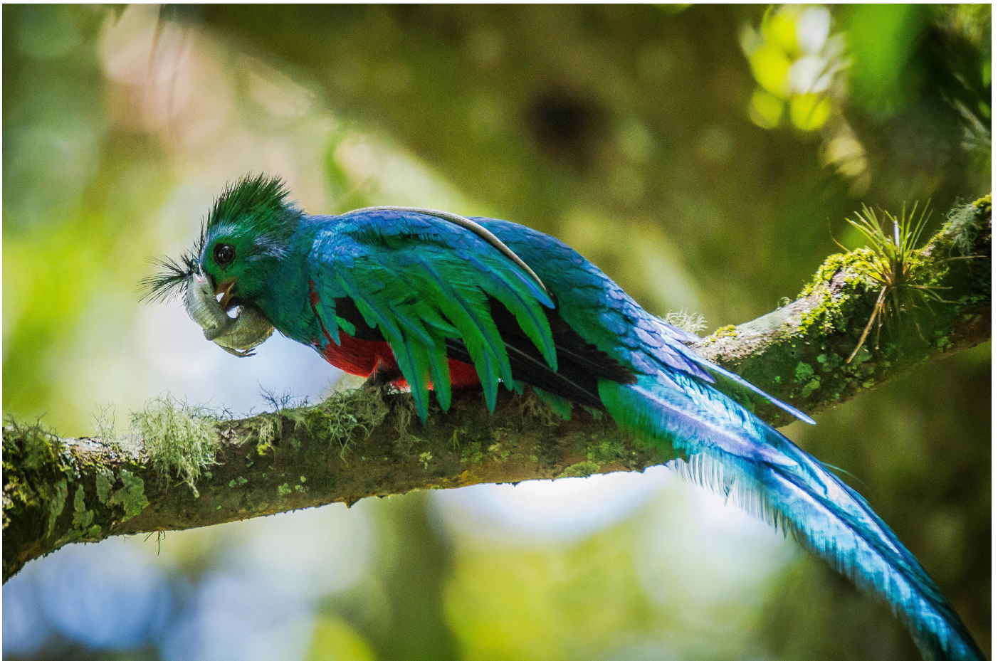
Figura 1. Macho adulto del quetzal mesoamericano ( Pharomachrus mocinno ) fotodocumentado el 12 de julio de 2020 depredando a una especie no determinada del género Abronia (posiblemente A. lythrochila ) en Tapalapa en las montañas al norte de Chiapas, México.

La dieta del quetzal en México ( P. m. mocinno ), fue identificada como frugívora en la Reserva