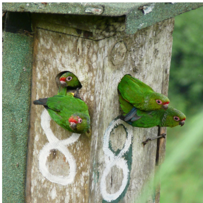
Figura 5. Nido artificial ocupado por un grupo de pericos de El Oro Pyrrhura orcesi , en la Reserva Buenaventura, provincia de El Oro, Ecuador.

Reportes en los que el género Aulacorhynchus funja como depredador son escasos. Por ejemplo, existen observaciones del tucanete esmeralda ( Aulacorhynchus prasinus ) en depredación de nidos de otras aves en Panamá (Wetmore 1968). Mientras que A. haematopygus sólo tiene un reporte conocido y proviene de la cordillera central de los Andes en Antioquia, Colombia, donde por medio de trampas cámara quedó registrado cuando depredaba huevos de tinamú grande ( Tinamus major ) (Arias-Alzate et al. 2012). En Ecuador muy poco se sabe de estos eventos, tan sólo los observados en la Reserva Buenaventura en el Proyecto de Conservación del Perico de El Oro y que originaron este estudio (Garzón-Santomaro 2004, Naranjo-Saltos 2007).