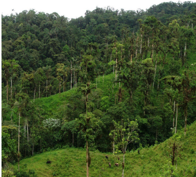
Figura 2. Hábitat del perico de El Oro, Pyrrhura orcesi en bosques y pastos arbolados en la Reserva Buenaventura, provincia de El Oro, Ecuador.