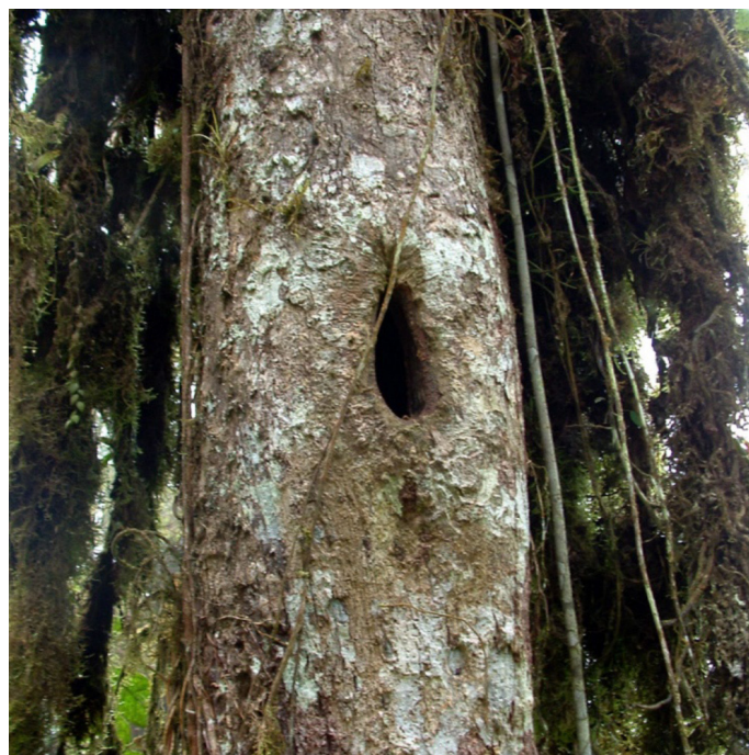
Figura 3. Primer nido encontrado del perico de El Oro Pyrrhura orcesi , el 7 de diciembre de 2002 en la Reserva Buenaventura, provincia de El Oro, Ecuador.

Al día siguiente, 12 de enero, a las 09:00 h, encontra-