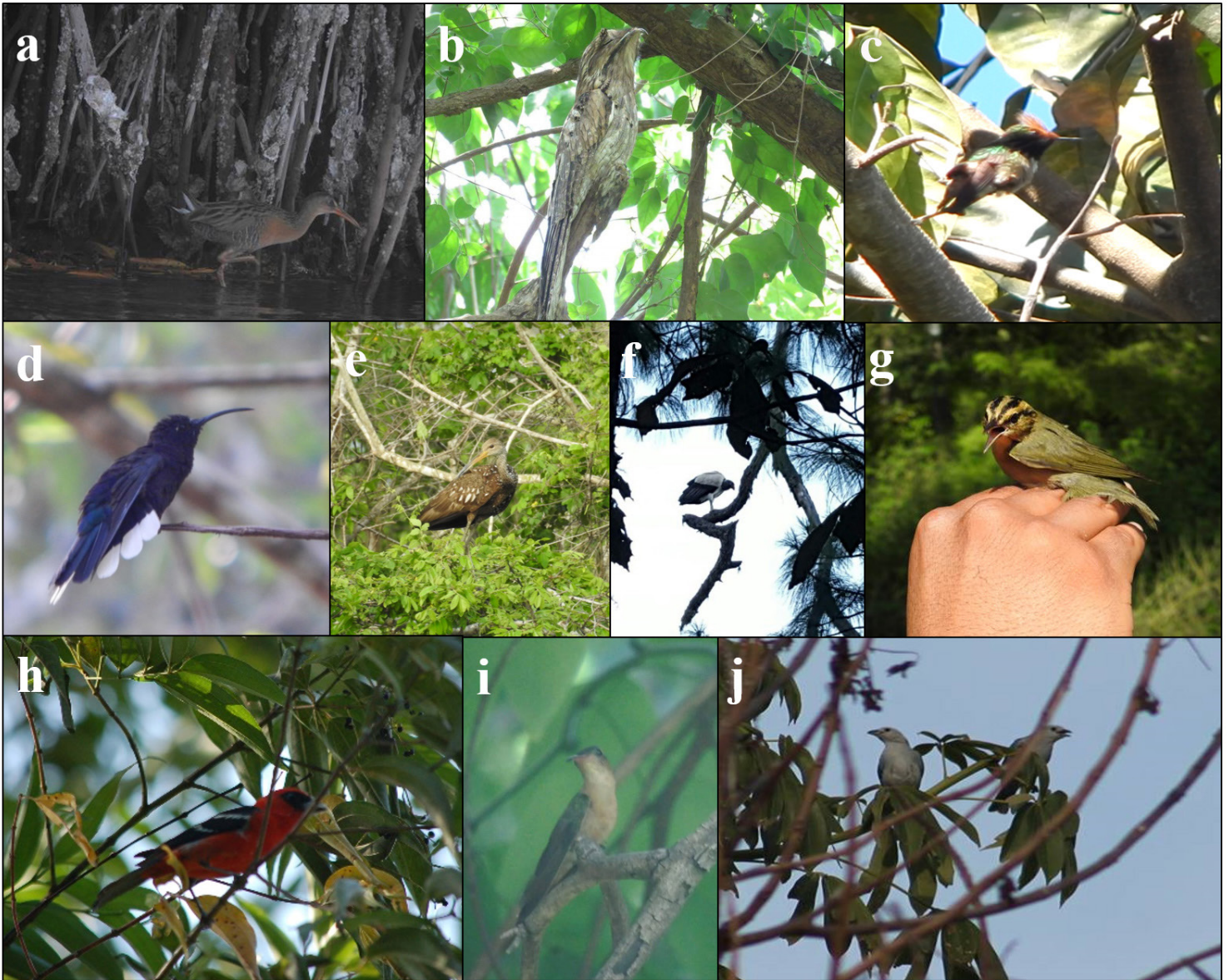
Figura 2. Evidencia fotográfica de las especies de aves registradas en el estado de Guerrero: a) Rallus obsoletus , b) Nyctibius jamaicensis , c) Lophornis brachylophus , d) Campylopterus hemileucurus , e) Aramus guarauna , f) Sarcoramphus papa , g) Helmintheros vermivorum , h) Piranga leucoptera , i) Amazilia rutila , j) Thraupis episcopus .

embargo, ocasionalmente se ha registrado esta especie en Guerrero. Los únicos registros provienen de localidades de Arroyo Grande, San Vicente de Benítez, Nueva Delhi en la Sierra de Atoyac (Howell y Webb 1994, Navarro 1998, GBIF 2018), en la porción central de Guerrero (Navarro-Sigüenza et al. 2003), así como en Barra Vieja, en Acapulco, y Lagunillas en Ixtapa-Zihuatanejo, que corresponden a los años 1998 a 2016 (eBird 2018, GBIF 2018, Figura 1). Debido a que los registros de la especie son relativamente recientes, el mapa de distribución potencial no incluye Guerrero (Navarro-Sigüenza y Peterson 2007i). El 24 de agosto de 2009 aproximadamente a 5 km al noreste de Las Compuertas registramos un individuo de P. leucoptera en un bosque