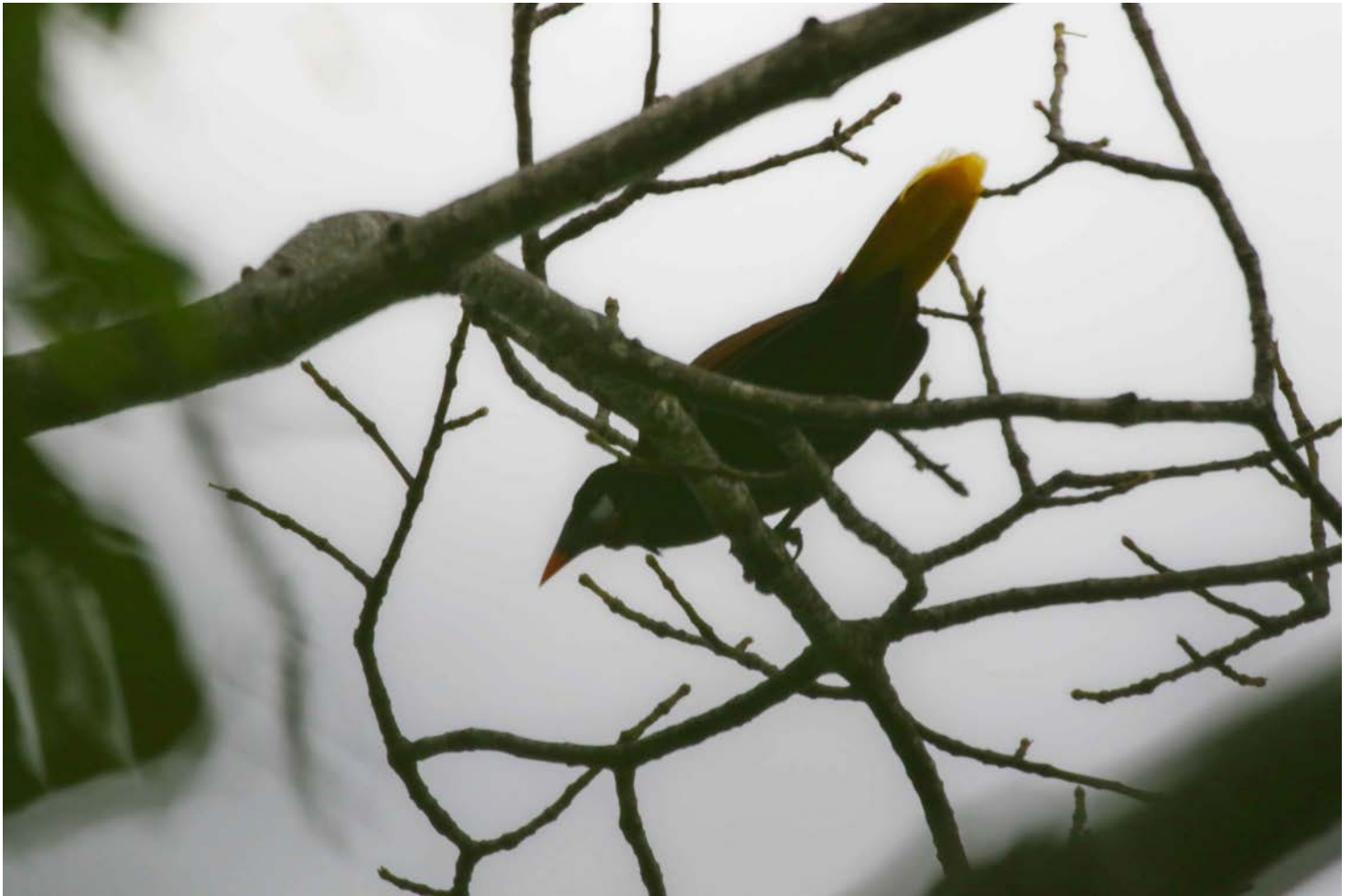
Figura 3. Psarocolius montezuma , detalle el patrón de colores en el pico, parche de la cara y coloración marrón castaño y coloración amarilla de la cola (foto: L. Pineda 31/05/ 2018).

y un diámetro a la altura del pecho de 3.52 m, al momento de la observación no contaba con follaje debido a la época transicional seca/lluviosa. Este árbol es utilizado como sitio de percha y alimentación de otras aves que se encontraban alrededor de P. montezuma , entre las cuales avistamos: el cabezón degollado ( Pachyramphus aglaiae ), chíó ( Tyrannus melancholicus ), torogoz ( Eumomota superciliosa ), cristofue ( Pitangus sulphuratus ), chonche ( Turdus grayi ), cacique mexicano ( Cassiculus melanicterus ), tordo ojos rojos ( Molothrus aeneus ), tordo gigante ( Molothrus oryzivorus ), tordo cantor ( Dives dives ), clarinero mayor/zanate ( Quiscalus mexicanus ). Con las últimas cinco especies de la misma familia Icteridae, el espécimen se desplazaba junto a ellos en una bandada mixta en busca de alimento.