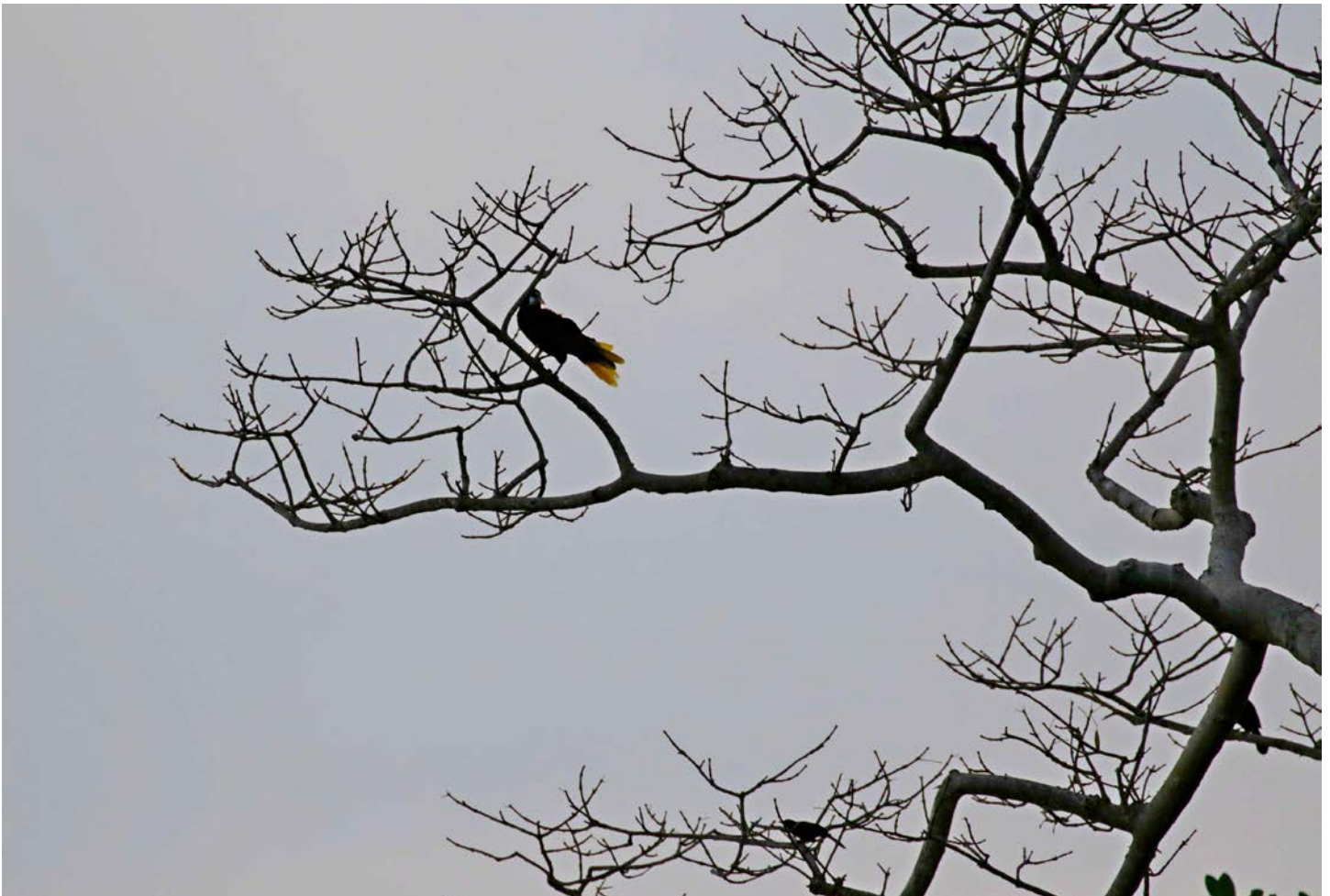
Figura 2. Comparación del tamaño de Psarocolius montezuma en relación con el tordo cantor ( Dives dives ) que se observa en las ramas inferiores del árbol.

A las 17:35 h observamos y fotografiamos a la especie (Figuras 2 y 3). El ave fue localizada en la misma Ceiba pentandra en donde la escuchamos por primera vez. El árbol tiene 25 m de alto