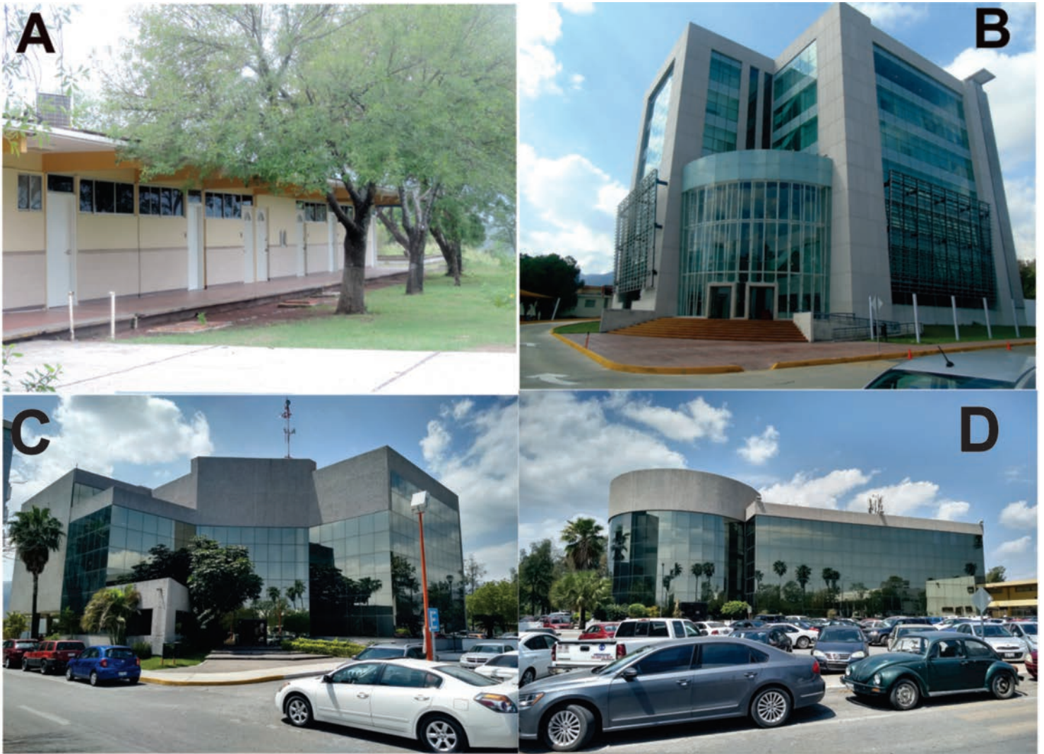
Figura 2. Diseño y estructura de algunas edificaciones dentro del área de estudio. A) Salones de la Facultad de Ingeniería y Ciencias (FIC), B) Centro de Gestión del Conocimiento (CGC), C) Centro de Excelencia (CE), D) Centro de Apoyo Universitario para la Creatividad y la Enseñanza (CAUCE).

cies colisionadas en el estudio de Cupul-Magaña (2003) y las 16 especies identificadas en el presente estudio. Quizás algunas especies son más vulnerables que otras, dadas las coincidencias de algunas especies reportadas en ambos trabajos, por ejemplo: Falco sparverius , Quiscalus mexicanus y Passer domesticus . Sin embargo, las cifras aún son pequeñas y se requiere de más estudios para llevar a cabo una comparación y analizar aquellas especies que no reconocen las ventanas como barrera y a menudo chocan con ellas (Klem 1989).