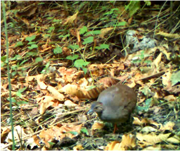
Figura 1. Individuo de tinamú canelo ( Crypturellus cinnamomeus ) fotografiado mediante una cámara trampa, en la localidad de Azinyahualco, municipio de Chilpancingo, Guerrero.

de bosque tropical subcaducifolio: Astronium graveolens , B. simaruba , Enterolobium cyclocarpum , Hymenaea courbaril , Peltogyne mexicana y Tabebuia rosea .