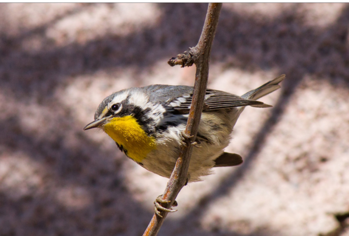
Figura 4. Setophaga dominica el 26 de enero del 2016 (12:46 h) en el municipio de Aldama, Chihuahua.

Esté avistamiento representa el primer registro en Chihuahua, incrementando su listado a 481 especies (I. Moreno com. pers.). BirdLife International (2013) menciona que “la tendencia de la población parece estar aumentando...” por lo que