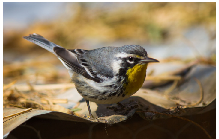
Figura 2. Setophaga dominica en el municipio de Aldama, Chihuahua, el 12 de enero de 2016 a las 12:05 h.

la primera imagen de un individuo de esta especie (Figura 3). Posteriormente registré otro individuo el 12 de enero y los días posteriores 13, 14 y 16 de enero a las 10:05, 11:28 y 12:03 h, respectivamente. El 19 de enero nuevamente observé el par de individuos entre las 11:33 y las 11:35 h., y fotografié un individuo (Figura 4) el día 26 de enero a las 12:46 h; finalmente, obtuve una fotografía más el 2 de febrero.