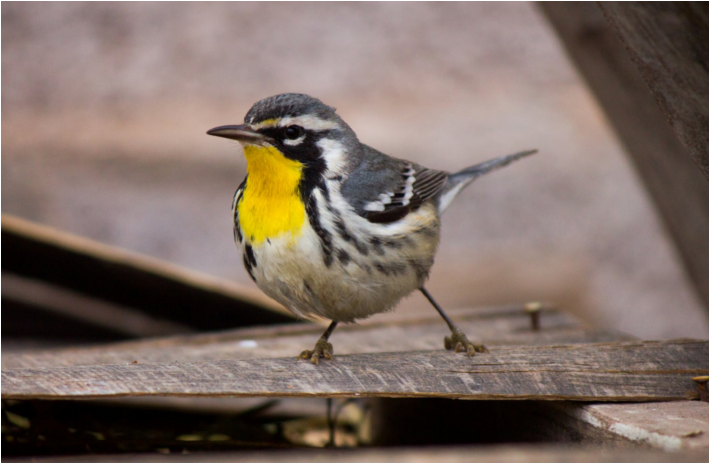
Figura 3. Setophaga dominica observado en el municipio de Aldama, Chihuahua, el 4 de enero de 2016 a las 11:14 h.