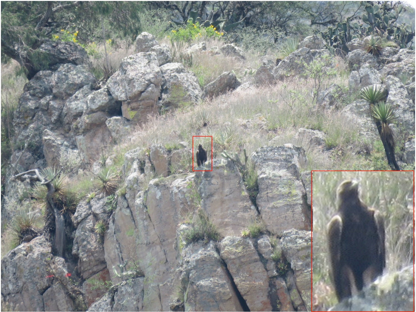
Figura 1. Individuo adulto de águila real perchado en una ladera en Mesita del Tigre, Guanajuato.

da; cabe señalar que los vimos en la misma área durante dos días, lo cual interpretamos, basados en experiencias previas con otras parejas de águila real de los estados de Aguascalientes y Zacatecas, que esta área forma parte de su territorio habitual de caza.