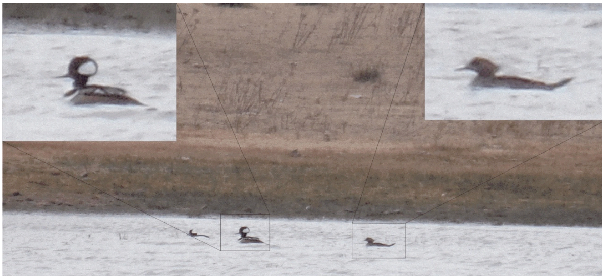
Figura 2. Macho (izquierda) y hembra (derecha) de Lophodytes cucullatus avistados en el municipio de Pinos, Zacatecas.

Los registros disponibles de L. cucullatus en México sugieren que la distribución invernal de la especie no se limita únicamente al norte del país, sino que también visita estados del centro y tal vez del sur. Sin embargo, consideramos que la información disponible aún no es suficiente para determinar una posible ampliación en su área de distribución, pero no descartamos que fenómenos como la urbanización, desecación de cuerpos de agua y la desestabilización climática podrían propiciar un incremento de las visitas de L. cucullatus a cuerpos lacustres, principalmente del centro de México. Los autores estamos de acuerdo con Howell y Webb (1995) al considerar que en México se podría tener incluso el doble de registro de especies que son consideradas como accidentales o visitantes de invierno si existieran más observadores de aves activos que reportaran sus avistamientos en plataformas de ciencia ciudadana como aVerAves.