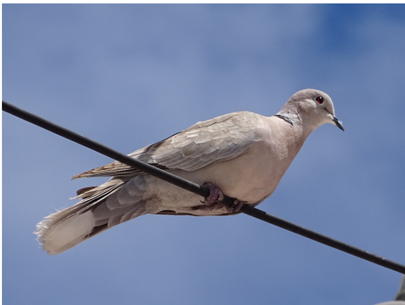
Figura 1. Tórtola turca ( Streptopelia decaocto ) registrada el 8 de mayo de 2015 en Guanamé, Venado, San Luis Potosí.

En cuanto a eventos reproductivos, encontramos un nido activo en periodo de incubación el 25 de marzo de 2013,