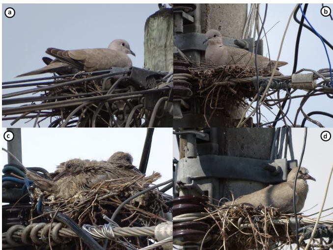
Figura 3. Nidos de la tórtola turca ( Streptopelia decaocto ) en el poblado de Tamuín: a) y b), nidos encontrados en etapa de incubación el 1 de febrero de 2015; c) y d), nidos activos en etapa de crianza registrados el 7 de junio de 2015.

2007, y Huejutla, 24 de marzo de 2010 (Valencia-Herverth et al. 2011). Esta información publicada, los registros de eBird (eBird 2015) y nuestros registros muestran que la especie ya está presente en gran parte del estado y la región (Figura 2). Los registros de anidación indican que esta especie exótica se ha establecido plenamente en la región y que seguramente tiene una distribución más amplia y continuará su expansión en el estado.