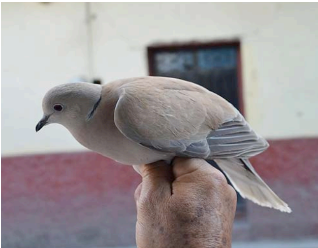
Figura 4. Individuo de paloma africana de collar ( Streptopelia roseogrisea ) en cautiverio, en la ciudad de Chilapa, Guerrero.

En el pasado, las palomas del género Streptopelia no estaban presentes en Guerrero. Entre otros inventarios avifaunísticos, una revisión del estudio más completo sobre la distribución geográfica y ecológica de la avifauna