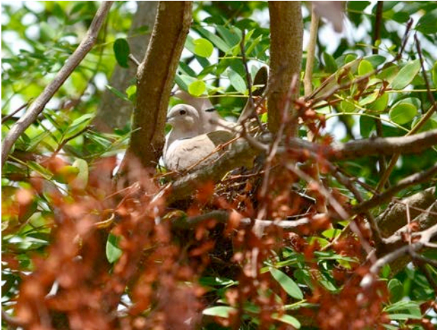
Figura 3. Streptopelia decaocto anidando en un árbol de cacahuananche ( Gliricidia sepium ) en Carrizal de Cinta Larga, municipio de Tecpan de Galeana, Guerrero.