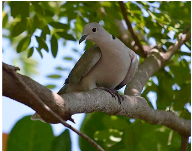
Figura 1. Paloma turca ( Streptopelia decaocto ) perchando en un árbol de cacahuananche ( Gliricidia sepium ), en Carrizal de Cinta Larga, municipio de Tecpan de Galeana, Guerrero (foto: E. Blancas-Calva).

Streptopelia roseogrisea : observamos a un individuo de paloma africana de collar perchando en un árbol de amate ( Ficus sp.) en la ciudad Chilapa de Álvarez, Guerrero (17°35'32.13"N, 99°10'47.57"O; 1420 msnm), el día 2 de febrero de 2011, a las 10:30 h; este individuo fue capturado por un lugareño y actualmente es mantenido como ave de ornato (Figura 4). En la misma fecha, a las 13:45 h, observamos a dos individuos de paloma africana de collar, perchando en el techo de una vivienda y a dos individuos más en la cornisa de la iglesia de San Antonio de la misma ciudad. De igual manera, hemos obtenido registros de la paloma africana de collar en Chilpancingo, Guerrero, de individuos que son mantenidos en cautiverio.