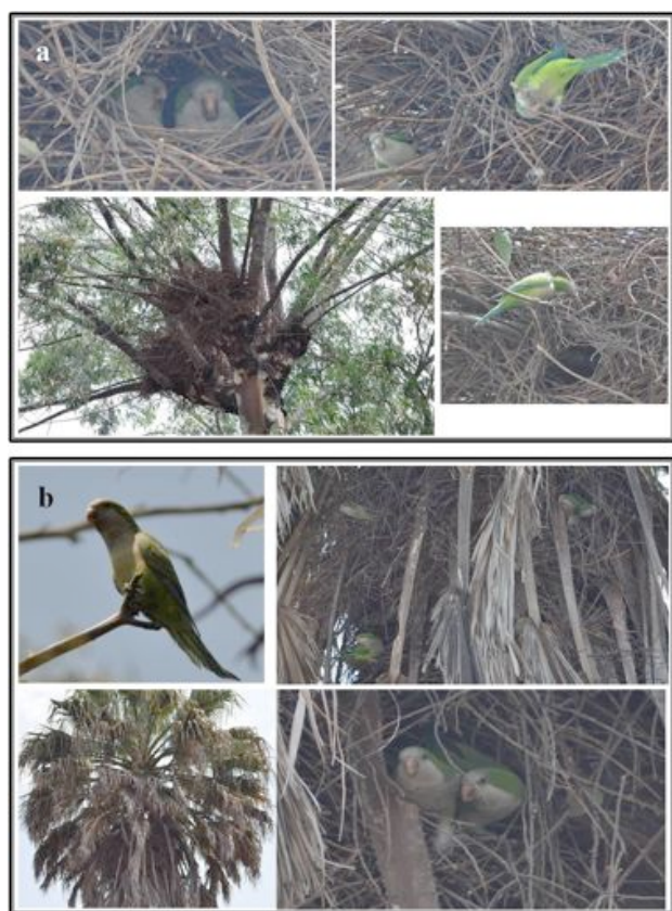
Figura 2. Nidos de cotorra argentina ( Myiopsitta monachus ) en: a) árbol de eucalipto en las afueras de la entrada principal de la Facultad de Estudios Superiores Zaragoza campus II y b) palmera en la entrada del Colegio de Postgraduados.

enero de 2009, se establecieron un par de ellos en una palmera ( Washingtonia robusta ) y en marzo del mismo año tuvieron una camada de dos polluelos. Sin embargo, uno de ellos según los comentarios de los vecinos, se cayó del nido y murió. En el Deportivo Francisco I. Madero, de agosto de 2008 a octubre de 2011, observé de dos a seis individuos sobrevolando y perchando en árboles de eucalipto ( Eucalyptus sp.). En los alrededores del Parque Ecológico Xochimilco he observado de cuatro a 10 individuos en árboles de eucalipto. En Viveros de Coyoacán, observé de dos a cuatro individuos sobrevolando la parte sureste y perchando en árboles de eucalipto de junio a agosto de 2009. Finalmente, en el Colegio de Postgraduados observé hasta 12 individuos perchando en árboles de eucalipto, pino y pirul, y alimentándose de los brotes de árboles de chabacano ( Armeniaca sp.) de enero a marzo de 2012. En este sitio localicé dos nidos en palmeras ( W. robusta ), aproximadamente a 45 y 55 m de la caseta de vigilancia de la entrada al Colegio; en uno observé hasta 14 individuos y en el otro dos individuos (Figura 2b).