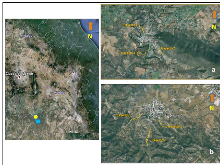
Figura 2. Sitios de observación del cardinal rojo ( Cardinalis cardinalis ) en el suroeste de Puebla. Tlancualpicán (●), a) y Huehuetlán El Chico (●), b).