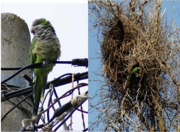
Figura 2. Perico argentino ( Myiopsitta monachus ) y nido 2 construido en un árbol de eucalipto en el parque recreativo Bosque “El Tequio” en la zona metropolitana de la ciudad de Oaxaca de Juárez, Oaxaca, México.

Aunque el perico argentino fue registrado previamente en el centro de México y se infiere su presencia en el norte, esta nota representa el primer registro de perico argentino anidando en el sur del país. Es posible que los individuos reportados en esta nota hayan sido liberados del cautiverio y, debido a que se encuentran en un área con condiciones climáticas favorables donde los recursos alimentarios son abundantes, pudiesen formar una población viable. Sin embargo, serán necesarios estudios que investiguen los parámetros poblacionales primarios de esta especie en la