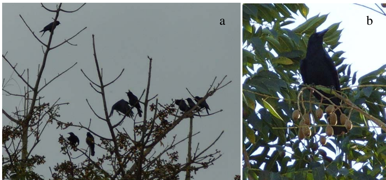
Figura 2. Corvus imparatus : a) perchando y vocalizando en el dosel de una ceiba ( Ceiba pentandra ) en San Felipe, Orizatlán; b) perchando en un árbol de cedro rojo ( Cedrela odorata ) frente las instalaciones del Instituto Tecnológico de Huejutla, Huejutla.

Las diferencias con el cuervo llanero ( C. cryptoleucus ), que ya había sido registrado en la entidad por Rojas-Soto et al. (2002), son principalmente la vocalización, el tamaño corporal, la forma del pico y la cola cuadrada que presenta el cuervo tamaulipeco. La carencia de registros de C. imparatus en Hidalgo se debe a la falta de estudios en el área de distribución potencial. Consideramos que es muy probable que la especie se encuentre también presente en los municipios de Chapulhuacán, Lolotla, Pisaflores, Tepehuacán de Guerrero, Xochiatipan y Yahualica. Debido a que la mayoría de los registros se obtuvieron durante la temporada de migración no reproductiva y a que encontramos una colonia de anidación, suponemos que C. imparatus tiene poblaciones residentes y migratorias