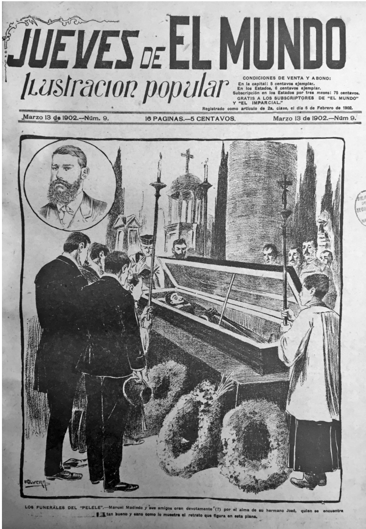
Eugenio Olvera Medina, "Los funerales del Pelele", Jueves de El Mundo (13 mar. 1902).