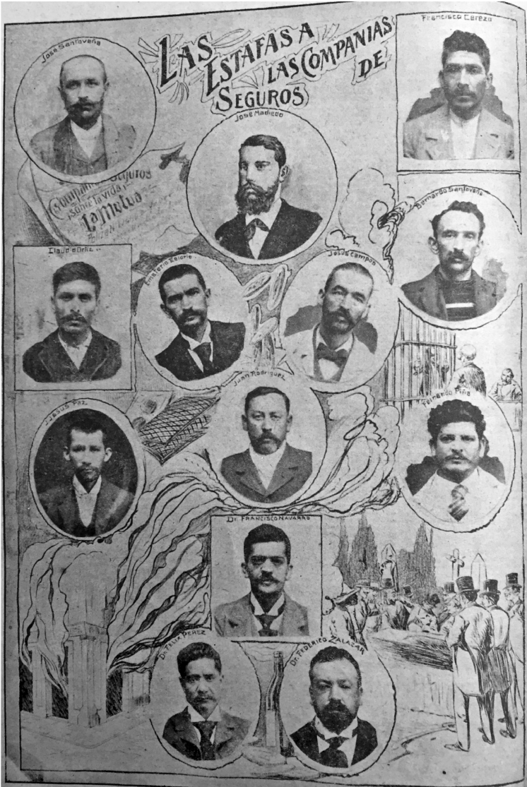
“Las estafas a las compañías de seguros”, Jueves de El Mundo (3 jul. 1902).