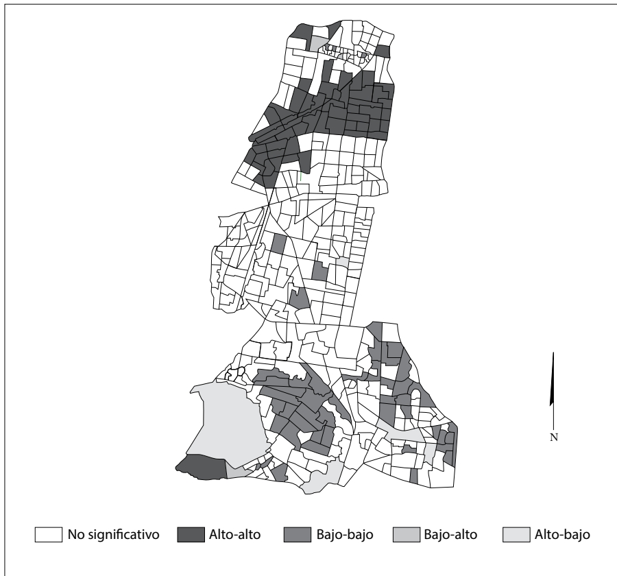
MAPA 3. Indicadores de asociación espacial para los robos a transeúntes en tres delegaciones de la Ciudad de México (2010)