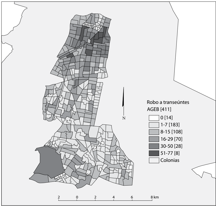
MAPA 2. Frecuencia de robo de transeúnte por AGEB, región de estudio, 2010