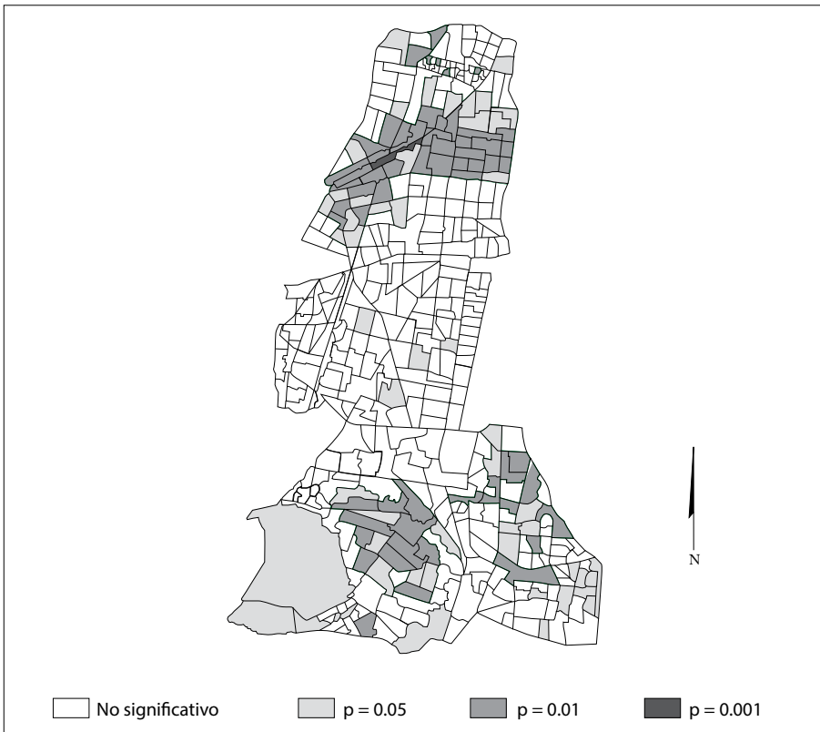
MAPA 4. Mapa de significancia estadística (ILAE)