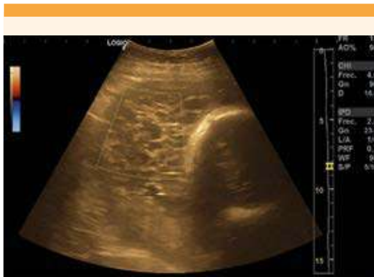
Figura 1. Ultrasonido obstétrico: fetometría promedio de 36.1 semanas, Doppler sin alteraciones, placenta fúndica con múltiples imágenes anecoicas en su interior, patrón en "racimo de uvas" de un 30%, con baja vascularidad.

del hospital a los dos días posteriores al evento obstétrico. Se indicó toma cuantitativa de hCG por días seriados; sin embargo, la paciente no acató la indicación.