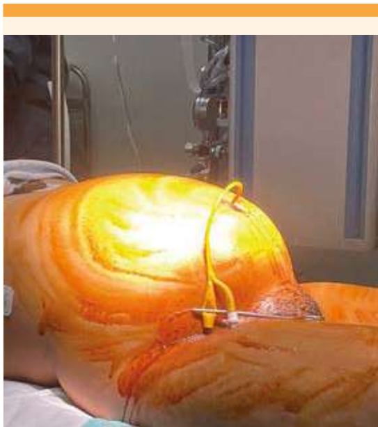
Figura 1. Colocación de sonda Foley 14 fr en vesicostomía para servir de guía durante el procedimiento.