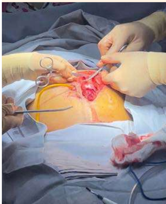
Figura 4. Múltiples adherencias en la pared abdominal que se cortan y ligan con seda 1-0.