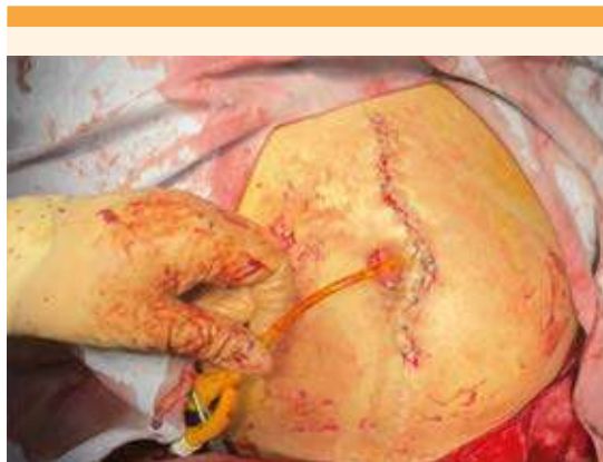
Figura 3. Incisión supra, media e infraumbilical y sonda Foley colocada en vesicostomía.