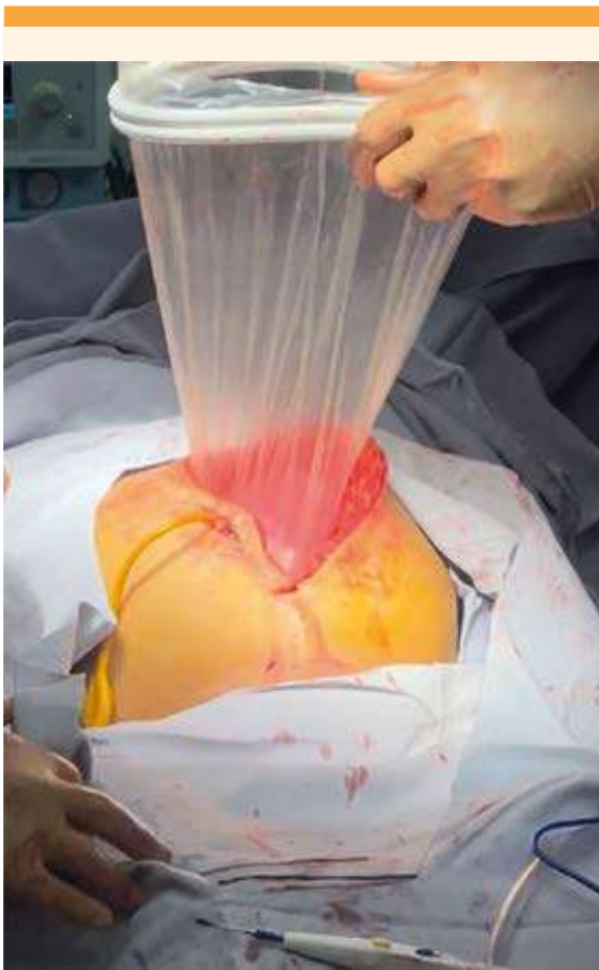
Figura 5. Colocación del separador tipo Alexis® que ayudó a la protección y retracción circunferencial traumática.

Al segundo día de puerperio la paciente tuvo un pico febril. A la exploración, las mamas se encontraron turgentes por lo que se procedió a la extracción de la leche. Los leucocitos y los reactantes de fase aguda se reportaron normales. La cefalosporina se cambió a una fluoroquinolona. El cultivo de orina, la secreción de la vesicostomía y de la herida quirúrgica se informaron negativos.