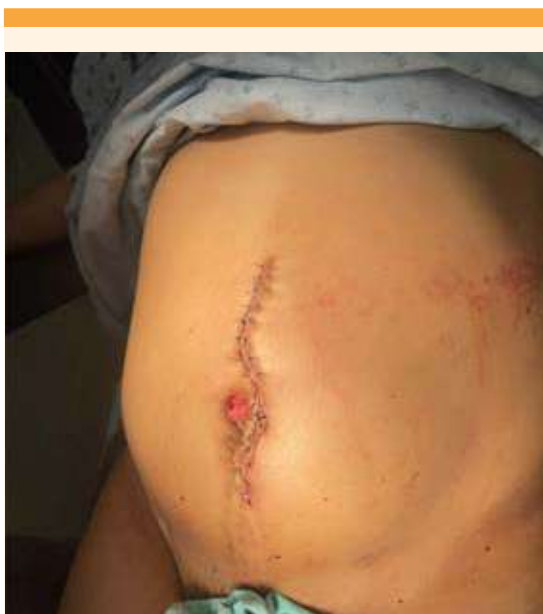
Figura 2. Incisión media supra, peri e infraumbilical para ampliación del campo quirúrgico.