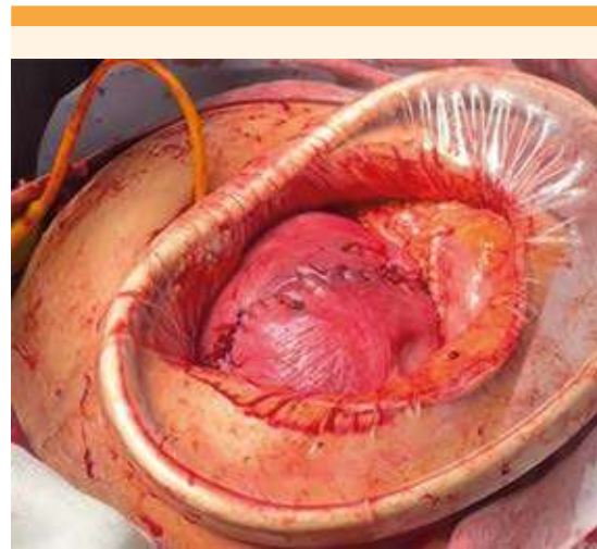
Figura 6. Incisión fúndica en útero.

Al tercer día de puerperio la paciente se encontró afebril y se dio de alta del hospital, con cita subsecuente para valoración urológica.